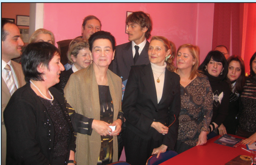
ბაგრატიონები აფხაზეთის ჯანდაცვის სამინისტროში

ბიულეტენი გამოდის ცხუმ-აფხაზეთის მიტროპოლიტ დანიელის (დათუაშვილის) ლოცვა-კურთხევით 2007 წლის ივლისიდან