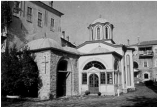
ტაძარი, სადაც ამჟამად დასვენებულია ივერიის ყოვლადწმიდა ღვთისმშობლის ხატი

ამის მოსმენამ ძმებს გამოუთქმელი სიხარული მოჰგვარა. მათ ყოვლადწმიდა ქალწულის სადიდებლად სავანის კარიბჭესთან მცირე ტაძარი ააგეს და მისი საკვირველთმოქმედი ხატიც იქ დაასვენეს. მას შემდეგ ხატი ღმრთისმშობლის მიერ გამორჩეულ ადგილზე ბრძანდება, რის გამოც იწოდება „პორტაიტისად“, ანუ „კარიბჭისად“ და, რადგანაც მან ივერთა სავანე აირჩია თავის სამყოფელად, ეწოდება „ივერიის ღმრთისმშობელი“. მას ძველთაგანვე კიდევ ერთი სა-