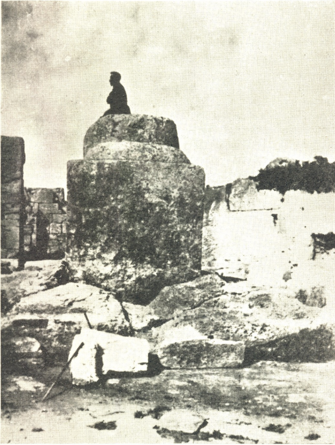
Voyage en Syrie. Il y identifia deux églises géorgiennes en ruines. On l'aperçoit sur la colonne du Stylite.

Son labeur pendant plus de cinquante ans se traduisant par d'innombrables œuvres, toutes de qualité hors pair, valut au R.P. Peeters, outre l'admiration et l'estime du monde scientifique, les plus hautes distinctions. Et tout d'abord, en 1930, celle qui lui fut accordée par le Pape Pie XI en