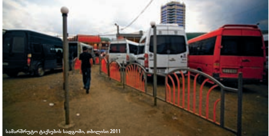
სამარშრუტო ტაქსების სადგომი, თბილისი 2011

■ სამივე კომპანიის დოკუმენტები დამონმებულია ერთი და იმავე ნოტარიუსის მიერ. სამივე კომპანიის კაპიტალი 100 ლარს შეადგენს.