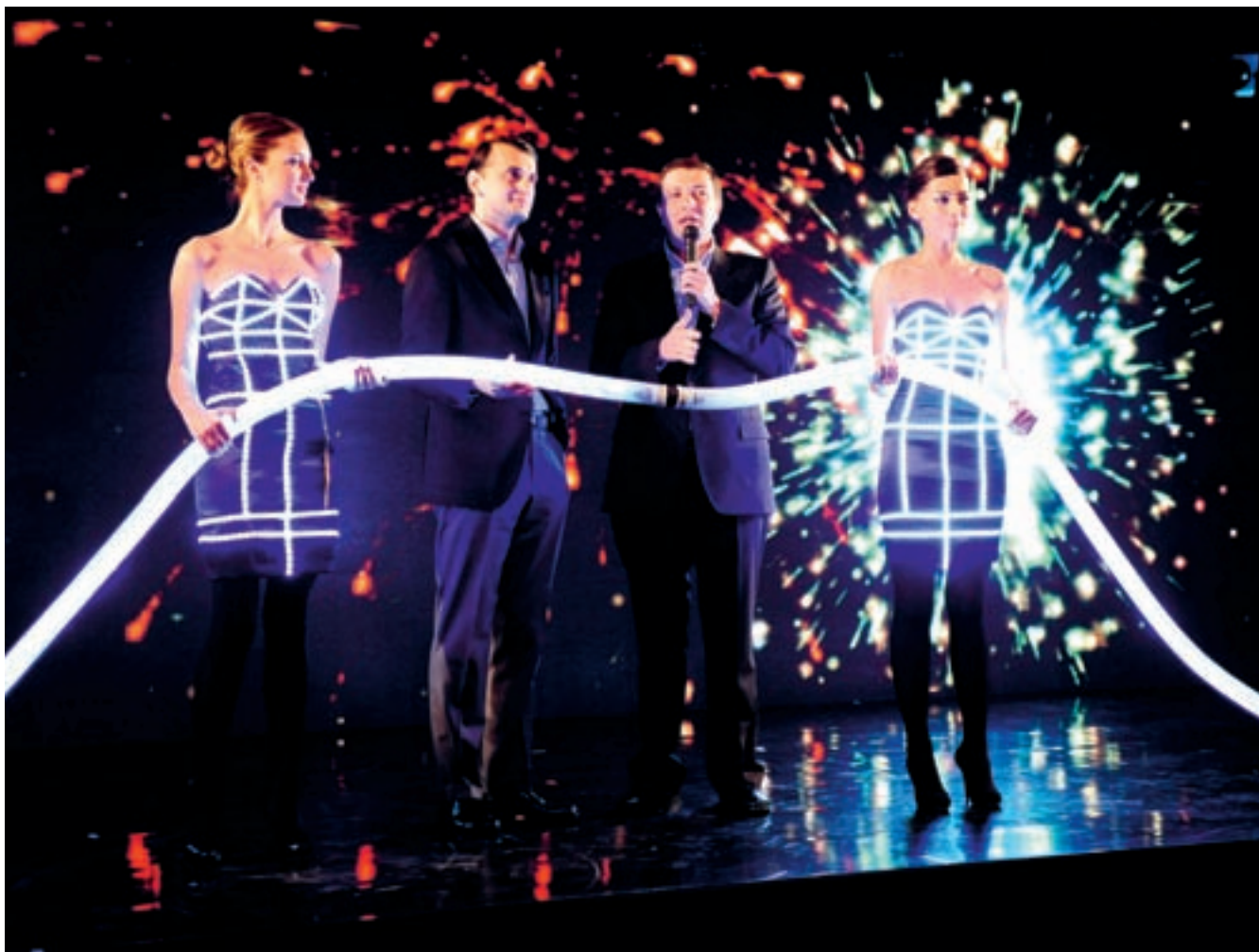
ფოტო სპრინგ ფაუნდერი