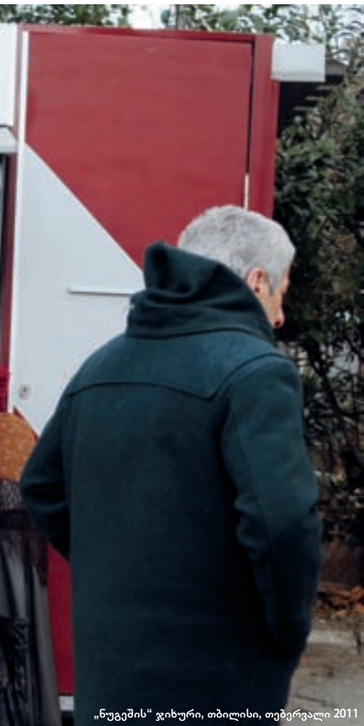
„ნუგეშის“ ჯიხური, თბილისი, თებერვალი 2011

■ თუ რა სახის შეღავათებს უწევს მერია „ნუგეშს“, ან როგორ ეხმარება ბიზნესის გაფართოებაში, მერიაში არ აკონკრეტებენ. თავად კომპანიაში აცხადებენ, რომ სავაჭრო ობიექტების ქუჩებში ჩადგმისთვის იჯარას არ იხდიან.