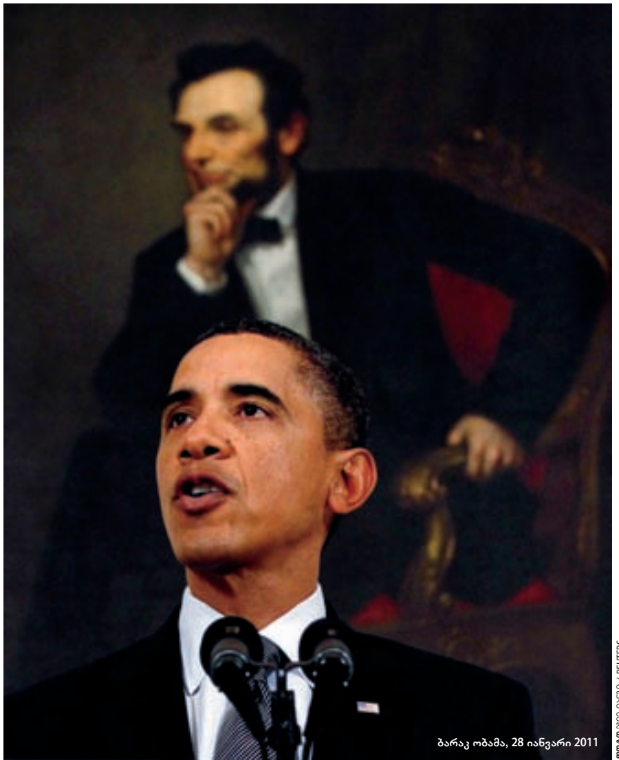
ბარაკ ობამა, 28 იანვარი 2011

2000-იანი წლების დასაწყისში პრეზიდენტ ჯორჯ ბუშის მიერ გამოცხადე-