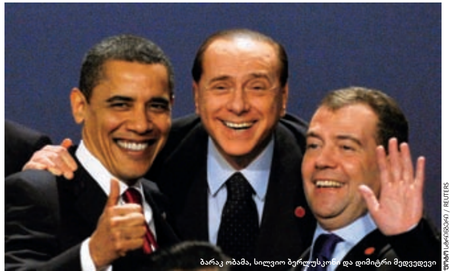
ბარაკ ობამა, სილვიო ბერლუსკონი და დიმიტრი მედევევი

ერთდროულად თამაშობს. მისი პირველი სვლა მუდამ უჩვეულო და დამაინტრიგებელია. „მე ჯერჯერობით არ მაქვს პრობლემა ამ პირველ სვლებთან მიმართებაში“, – დასძინა კისინჯერმა. რომ არაფერი ვთქვათ ირანზე, ავღანეთზე, ახლო აღმოსავლეთზე, ჩინეთზე და ა.შ. ძალზე საინტერესოა, როგორ გაართმევს თავს ობამა კრემლის გარდაუვალ შანტაჟებს და როგორ მიიყვანს ბოლომდე ევროპაში ჰაერსაწინააღმდეგო კომპლექსების მშენებლობას. შესაძლოა, იმ დიდი მოლოდინის ფონზე, რომელიც ორი წლის წინ ობამას თეთრ სახლში შესვლას ახლდა, მისი მიღწევები ჯერჯერობით არცთუ თვალსაჩინო იყოს. თუმცა, პირველი საპრეზიდენტო ვადის შუაში დიდი სირ-