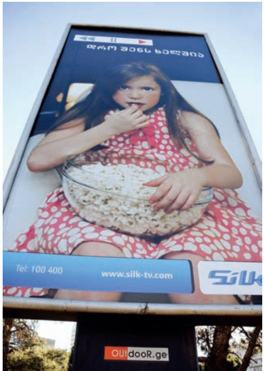
საინფორმაციო ოცნება სტუდია

ასოციაციამ პრესის გავრცელებასთან დაკავშირებული საკანონმდებლო ინიციატივა მოამზადა, რომლის მიზანიც ბეჭდვითი პროდუქციის გავრცელების ხელშემწყობი პირობების და ბეჭდვითი პროდუქციით თავისუფალი ვაჭრობისა და კონკურენციის შესაძლო შეზღუდვისაგან დაცვა იყო. კანონპროექტი 2010 წლის გაზაფხულზე იყო ინიცირებული, თუმცა პარლამენტს ის დღემდე პირველი მოსმენითაც არ განუხილავს. ■