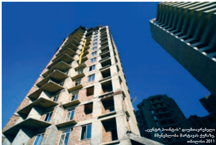
„ცენტრ პოინტის“ დამფუძნებელი მენეჯლობა შარტავას ქუჩაზე, თბილისი 2011

სტატია დაფინანსებულია „ევროკომისიის“, „ლია საზოგადოება – საქართველოს“ და „ევრაზიის თანამშრომლობის ფონდის“ მიერ.