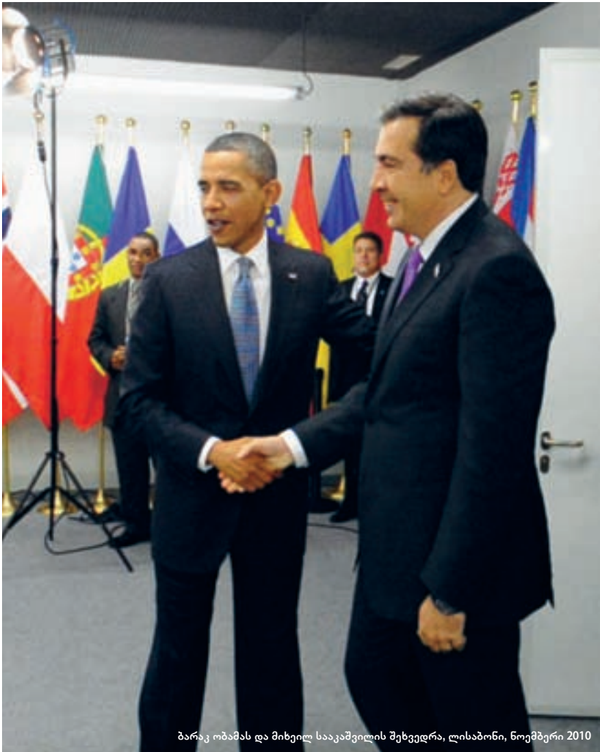
ბარაკ ობამას და მიხეილ სააკაშვილის შეხვედრა, ლისაბონი, ნოემბერი 2010

შემდეგ შეერთებულ შტატებში აირჩიეს დემოკრატი ბარაკ ობამა, რომელსაც მრჩეველები აფრთხილებენ, რომ წინამორბედი ბუშის პოლიტიკა საქართველოსთან მიმართებაში გადაჭარბებული იყო. ეს სიმართლეა