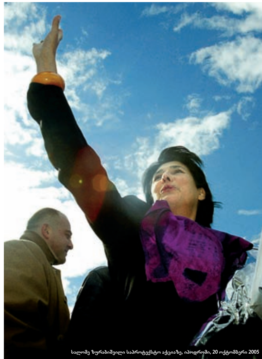
სალომე ზურაბიშვილი საპროტესტო აქციაზე, იპოდრომი, 20 ოქტომბერი 2005

არა – გარიგებას! ეს იყო მთავარი მოწოდება იმ 114 დღის განმავლობაში, როცა ჩვენ ერთად – და ზოგჯერ მარტო – ვიდექით პარლამენტის წინ. გარიგება ძალიან მაცდურია, რადგან მას ყოველთვის შეიძლება გამართლება მოუძებნო: „მე თუ არა, სხვა იქნებოდა!“ „უარესი იქნებოდა, სხვა რომ ყოფილიყო!“, „თუ