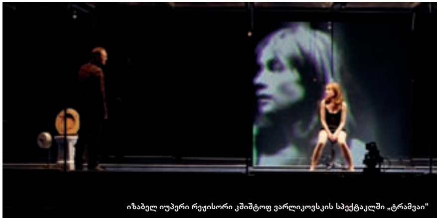
იზაბელ იუპერი რეჟისორი კშიშტოფ ვარლიკოვსკის სპექტაკლში „ტრამვაი“

„ფესტივალჰაუზის“ გადაჭედილი დარბაზი ბერლინში, დაახლოებით 20 წუთის განმავლობაში, უკრავდა ტაშს ფრანგ კინოვარსკვლავს იზაბელ იუპერს, რომელმაც ბრწყინვალედ ითამაშა ბლანშ დიუბუას როლი პოლონელი რეჟისორის, კშიშტოფ ვარლიკოვსკის სპექტაკლში „ტრამვაი“ (ტენესი უილიამსის ცნობილი პიესის, „ტრამვაი, რომელსაც სურვილი ჰქვია“, მიხედვით). ფრანგი ვარსკვლავი თეატრალურ ამპლუაში უკვე მეორედ სტუმრობდა ბერლინს. ამ ქალაქს დღესაც კარგად ახსოვს 2007 წელს სახელოვანი რობერ ვილსონის მიერ დადგმული „კვარტეტი“ (ჰაინერ მიულერის პიესა), სადაც იუპერი ცბიერ, ჭკვიან და სექსუალური კომპლექსებით შეპყრობილ მარკიზა დე მერტეის თამაშობდა. და აი, ახალი, კიდევ ერთი შესანიშნავი თეატრალური როლი, რომელსაც გერმანულმა პრესამ უკვე დიდი შეფასება მისცა.