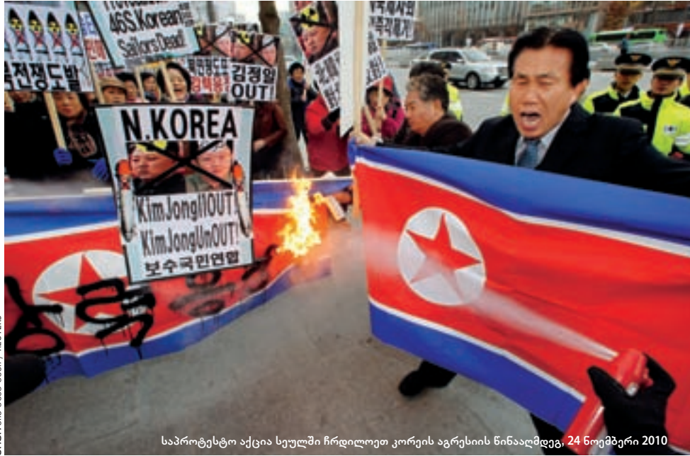
საპროტესტო აქცია სეულში ჩრდილოეთ კორეის აგრესიის წინააღმდეგ, 24 ნოემბერი 2010

სამხრეთ კორეელები ამ ზონაში სამუშაოდ თავის ყველაზე მაღალ, 174-სმ-ს გადა-