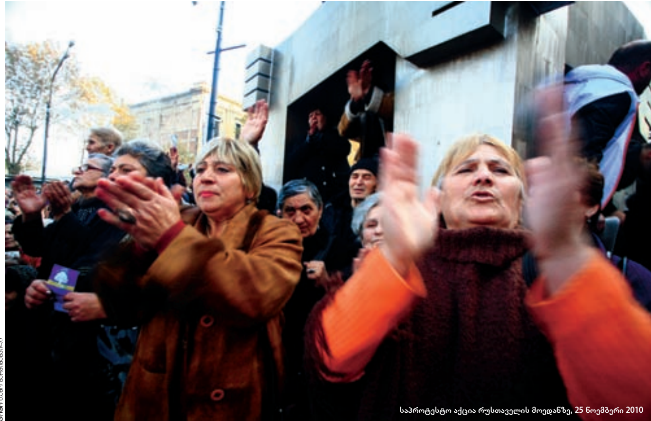
საპროტესტო აქცია რუსთაველის მოედანზე, 25 ნოემბერი 2010

ცოტა შორიდან უნდა მოვუარო: ქართველებს რომ მიტინგები ოდითგანვე გვიყვარდა, ამას პირველი ქართული ლიტერატურული ძეგლი „შუშანიკის ნამებაც“ ადასტურებს. გარდა იმისა, რომ მოთხრობა ოჯახურ ძალადობას შეეხება, მან პირველი ქართული მიტინგის დარბევის სცენაც შემოგვინახა. მაშინ, როცა შუშანიკი, „უხამური და თმაგარდატევებული“ საპრობოლისკენ მიჰყავდათ, მის მხარდასაჭერად უამრავი ადამიანიც მოსულა: „და ვითარცა იხილა პიტიახშმან ამბოხი იგი და ტირილი დედათა და მამათაი, მოხუცებულთა და ყრმათაი, მხედრ მიმოსდევნიან და მეოტჰყოფენ მათ ყოველთა“ – ახუ, ვარსკენის