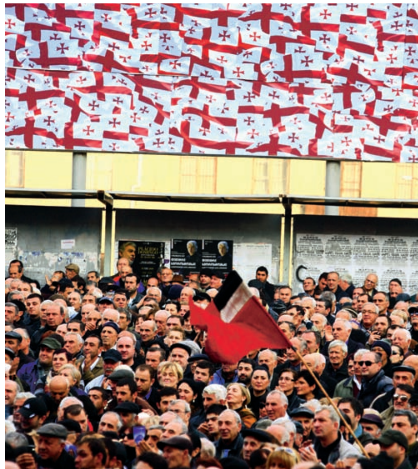
■ სააგენტო ფრანს-პრესის მონაცემებით, რუსთაველის გამზირზე „სახალხო კრებას“ 7 000-ზე მეტი ადამიანი დაესწრო. „ფიგარო“ აქციას „2009 წლის შემდეგ ყველაზე ხალხმრავალი ოპოზიციური მანიფესტაცია“ უწოდა. ქართულ საინფორმაციო გამოშვებებში აქცია გადაცემების ბოლოს, 30-ე წუთის შემდეგ მოხვდა. ამ სიუჟეტებში პარლამენტის შენობის მიმდებარე ტერიტორია მაშინ უჩვენეს, როცა ის დაცარიელდა.