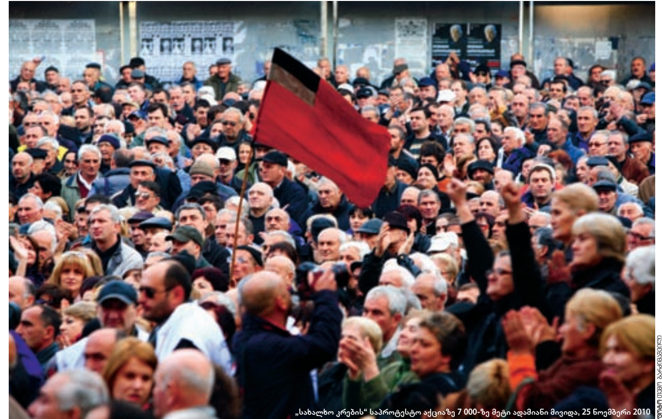
„სახალხო კრების“ საპროტესტო აქციაზე 7 000-ზე მეტი ადამიანი მივიდა, 25 ნოემბერი 2010