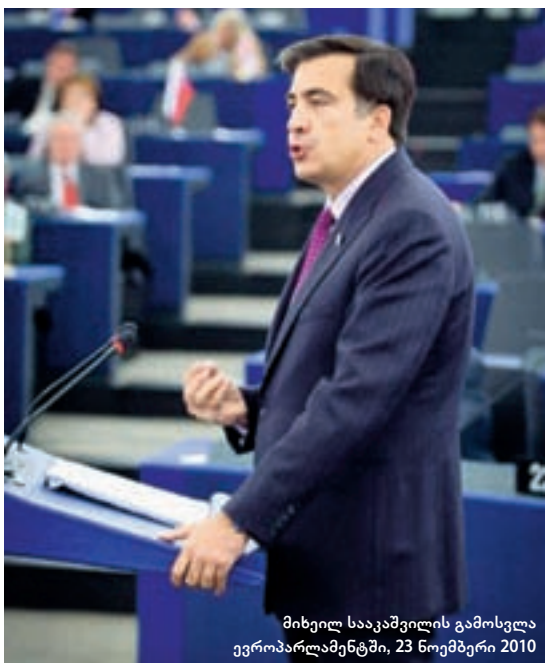
მიხეილ სააკაშვილის გამოსვლა ევროპარლამენტში, 23 ნოემბერი 2010

ბი, ვისაც ვილაცის ჩექმების კოცნის მოთხოვნა აქვთ დღე და ღამე.“ – ეს სააკაშვილის სიტყვებია მათზე, ვინც რუსეთთან დაახლოებას ცდილობდა.