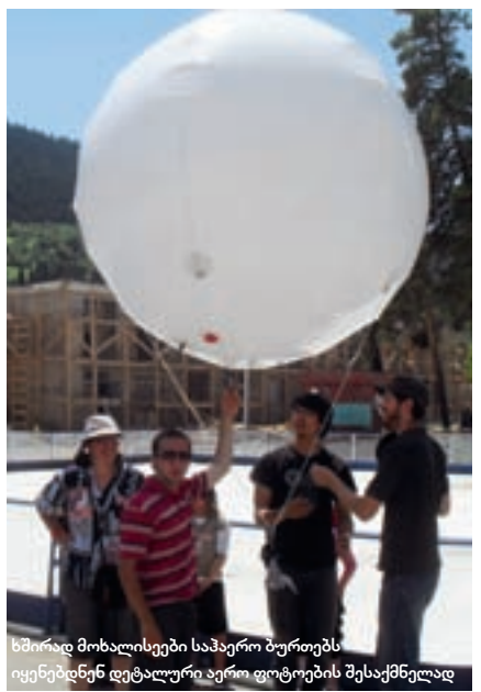
ხშირად მოხალისეები საჯარო ბურთებს იყენებდნენ დეტალური აერო ფოტოების შესაქმნელად

ინტერაქტიულ რუკაზე მუშაობა 800-მდე რიგითი ქართველისთვის სახალისო გამოცდილებად იქცა. „რუკაზე მუშაობა ბარისახოდან დაიწყო და სულ ოთხი სოფლის რუკა შევადგინეთ. მთლიანობაში პირაქეთა ხევისურეთის რუკები ორ კვირა-