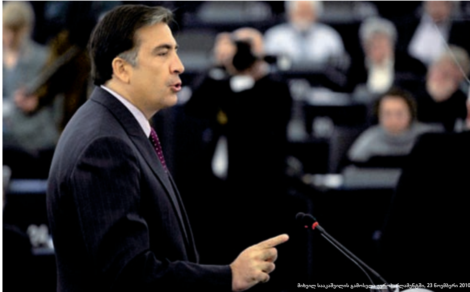
მიხეილ სააკაშვილის გამოსვლა ევროპარლამენტში, 23 ნოემბერი 2010

პარლამენტის ევროპასთან ინტეგრაციის კომიტეტის თავმჯდომარე