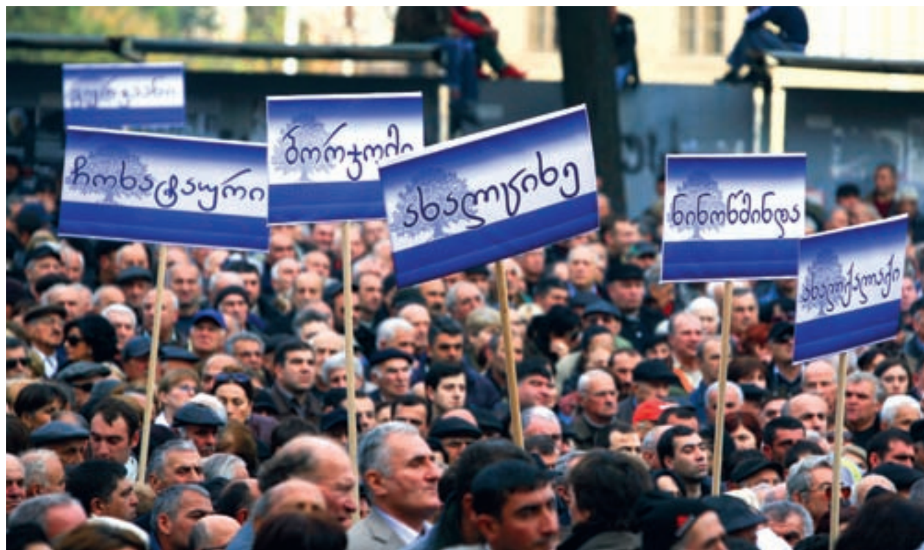
■ აქციას რეგიონებიდან ჩამოსული ხალხიც შეუერთდა. „სახალხო კრების“ დასრულების შემდეგ ისინი პარლამენტის წინ ღია ცის ქვეშ დარჩნენ. მათი თქმით, კრების ორგანიზატორებმა მათ კვებაზე და თავშესაფარზე არ იზრუნეს.