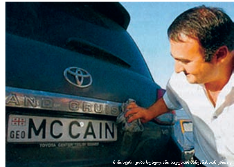
მინისტრი კობა სუბელიანი საკუთარ მანქანასთან ერთად

საქართველოში ამერიკული პოლიტიკის განხილვის დროს ერთ უცნაურ და ოდნავ სასაცილო ტენდენციას ვამჩნევ: ყველა, ვინც სააკაშვილს უჭერს მხარს, პარალელურად რესპუბლიკელი სენატორის – ჯონ მაკკეინის „ფანია“ და რესპუბლიკური პარტიის მგზნებარე მხარდამჭერი.