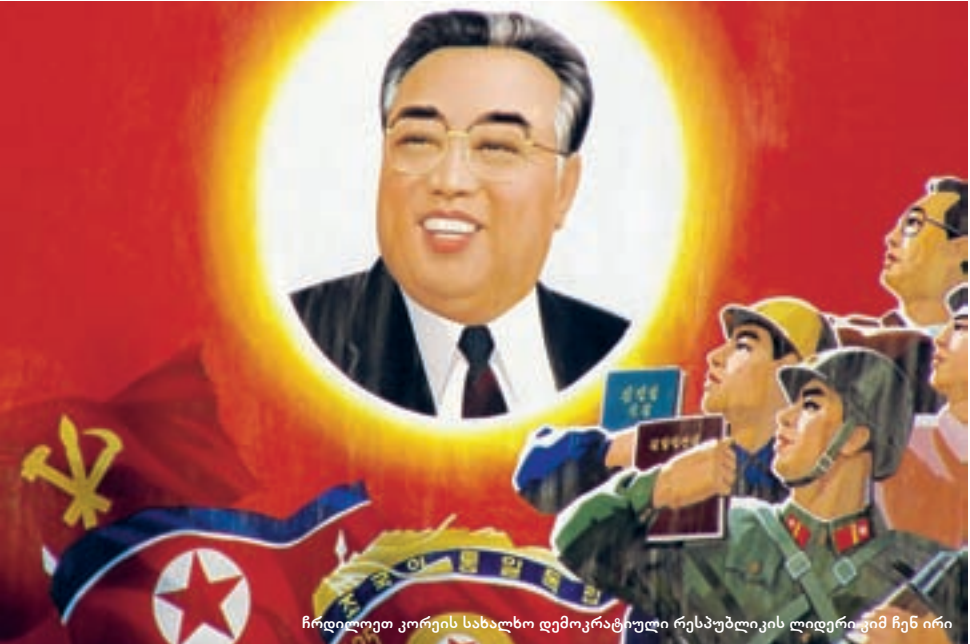
ჩრდილოეთ კორეის სახალხო დემოკრატიული რესპუბლიკის ლიდერი კიმ ჩენ ირი

ჩრდილოეთ კორეის საჩვენებელ დედაქალაქში მხოლოდ მდიდრები და პარტიის ერთგული წევრების ოჯახები ცხოვრობენ. ქალაქის ქუჩებში ტანკები და მძღოლიანი