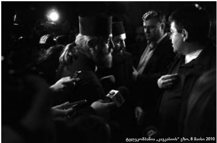
ტელეკომპანია „კავკასიის“ ეზო, 8 მაისი 2010