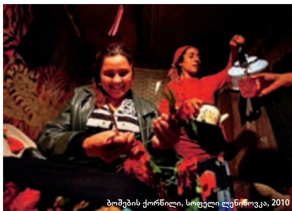
ბოშების ქორწილი, სოფელი ლენინოვკა, 2010