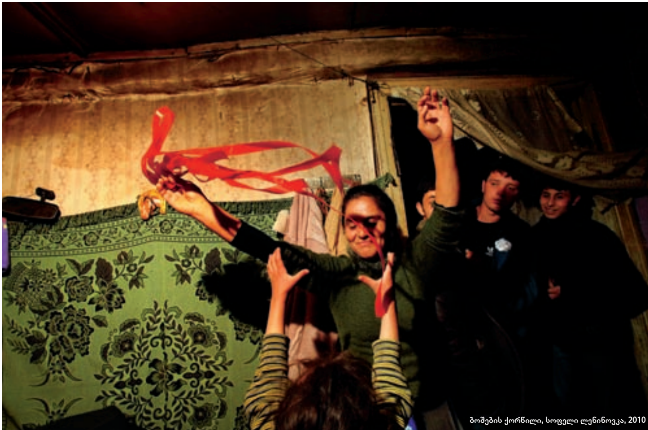
ბოშების ქორწილი, სოფელი ლენინოვკა, 2010