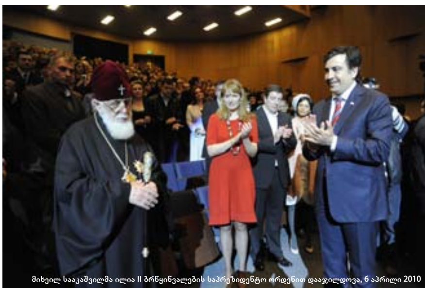
მიხეილ სააკაშვილმა ილია II ბრწყინვალეების საპრეზიდენტო ორდენით დააჯილდოვა, 6 აპრილი 2010

საქართველოს პრეზიდენტის ინიციატივით, სახელმწიფო ჯილდოებს ახალი პრემია შეემატება – მედალი სამოქალაქო თავდადებისთვის.