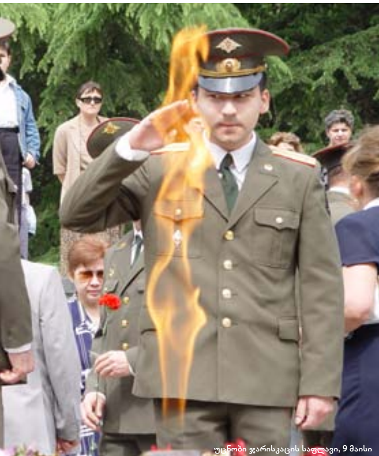
უცხოში ჯარისკაცის საფლავი, 9 მაისი