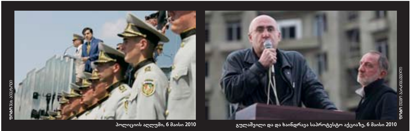
პოლიციის ალღუმი, 6 მაისი 2010