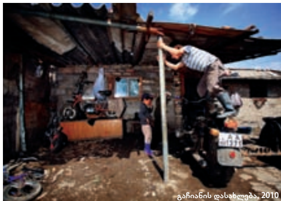
გაჩიანის დასახლება, 2010