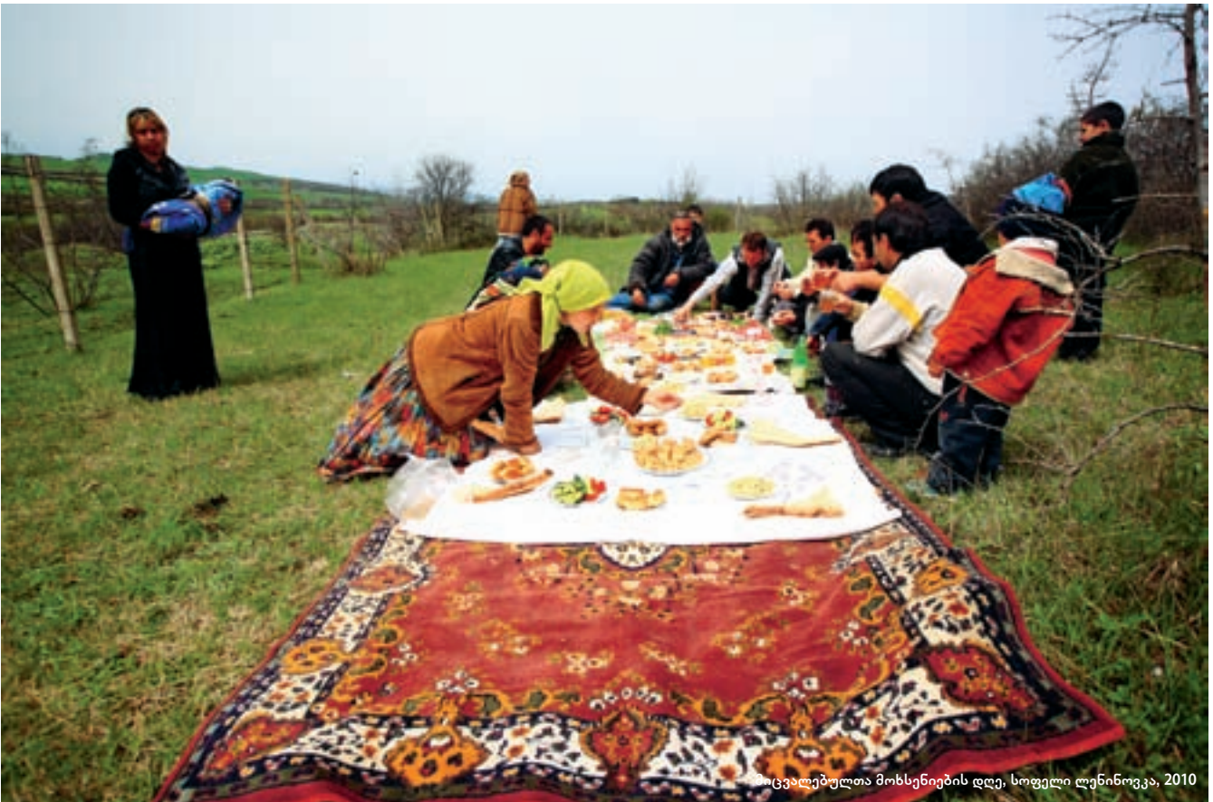
მცვალეპულთა მოხსენიების დღე, სოფელი ლენინოვკა, 2010

უმსიკრესობა, რომელიც ოფიციალურად არ არსებობს