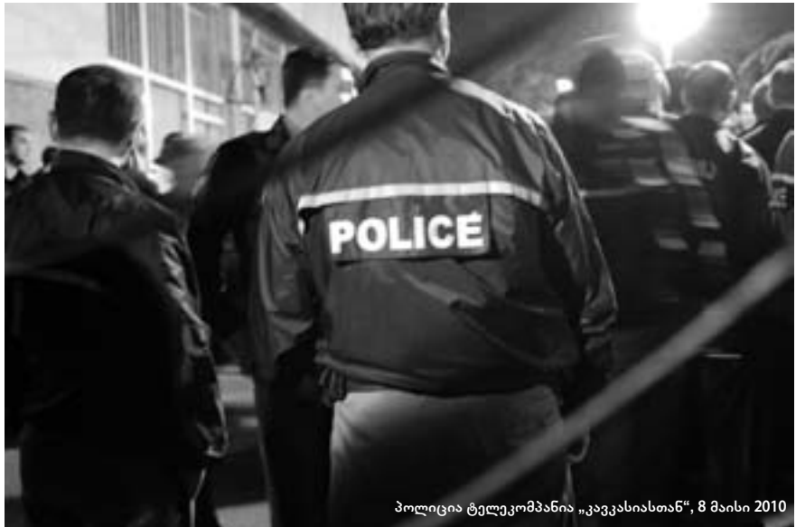
პოლიცია ტელეკომპანია „კავკასიასთან“, 8 მაისი 2010