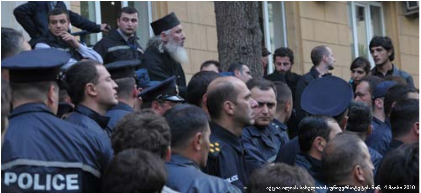
აქცია ილიას სახელობის უნივერსიტეტის წინ, 4 მაისი 2010