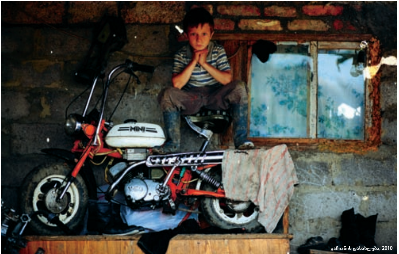
გაჩიანის დასახლება, 2010