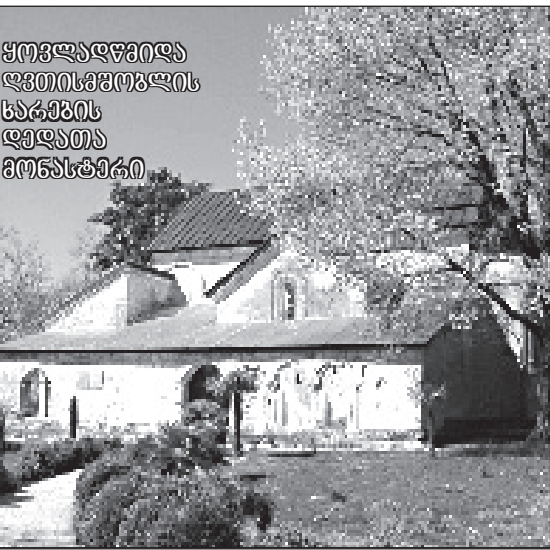
ყოველდღიურად ღვთისმშობლის ხარების დედათა მონასტერი