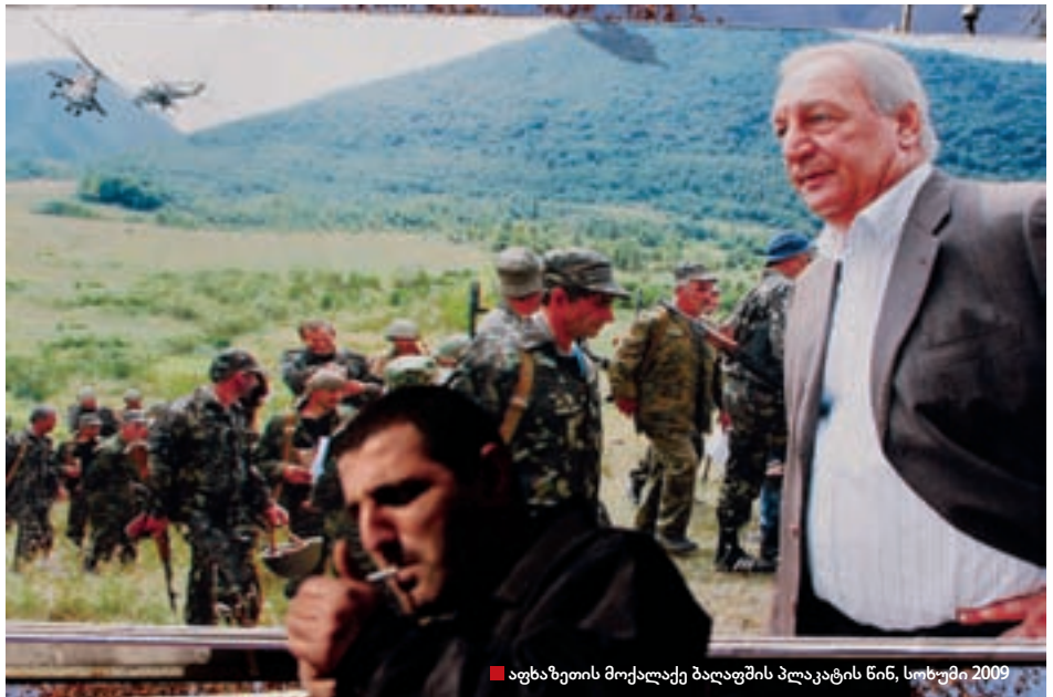
■ აფხაზეთის მოქალაქე ბალაფშის პლაკატის წინ, სოხუმი 2009

ზოგიერთი სტატისტიკური მონაცემი მართლაც საეჭვოა. უცნაურია, რომ ამომრჩეველთა რაოდენობის 139 ათასამდე გაზრდა მხოლოდ არჩევნების შემდეგ გახდა ცნობილი. არჩევნების დაწყებამდე ეს მაჩვენებელი მხოლოდ 127 ათას 600 იყო. სხვაობა საკმაოდ დიდია, თან იმის გათვალისწინებით, რომ გალის მოსახლეობას არჩევნებში მონაწილეობა არ მიუღია, როგორც ეს ხუთი წლის წინ იყო.