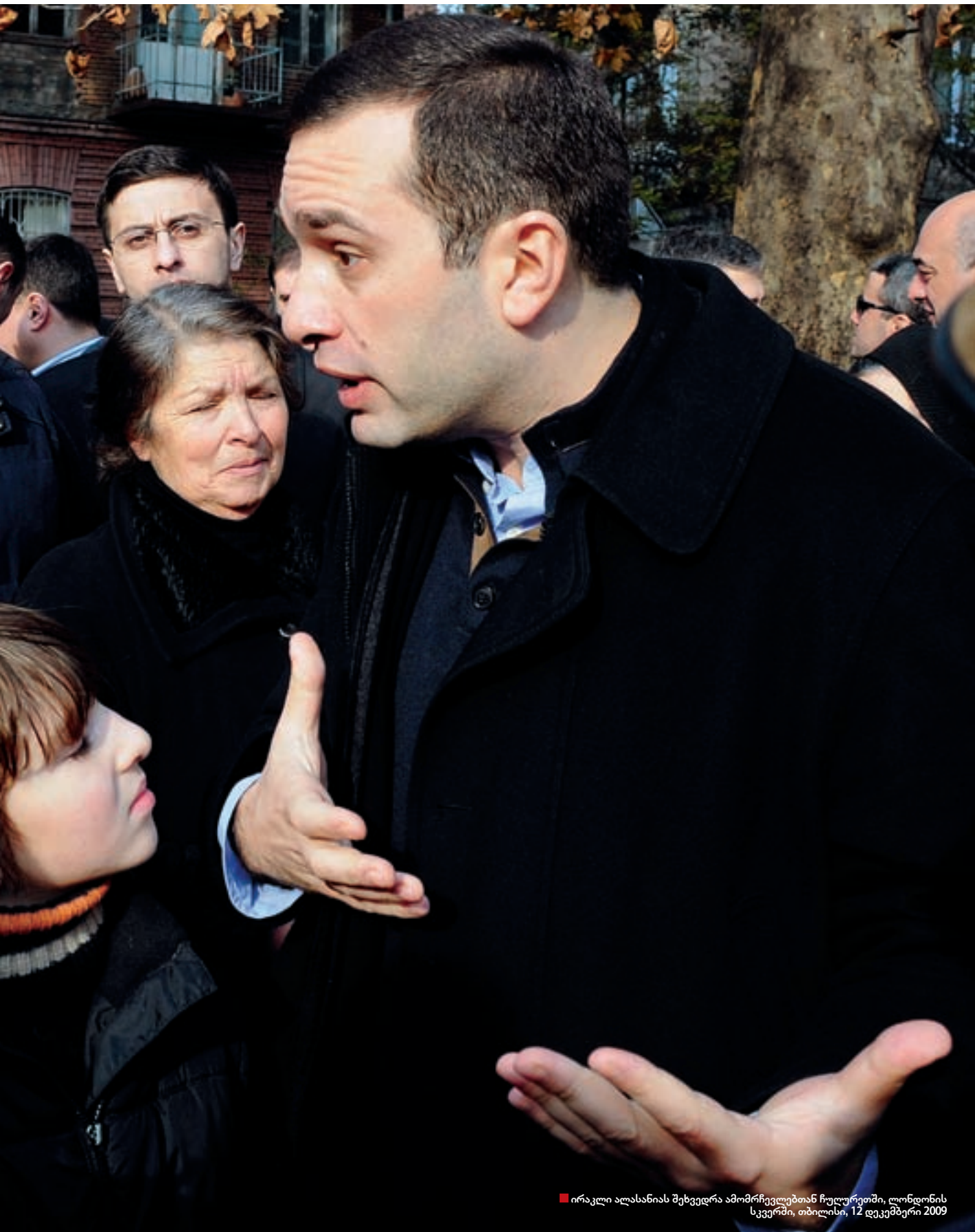
■ ირაკლი ალასანიას შეხვედრა ამომრჩევლებთან ჩუღურეთში, ლონდონის სკვერში, თბილისი, 12 დეკემბერი 2009