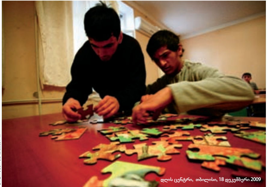
დღის ცენტრი, თბილისი, 18 დეკემბერი 2009

ახალი სისტემის მიხედვით, ის, ვინც სიღარიბის სტატუსის დასადგენად საჭირო 100 000 ქულაზე ნაკლებს მოაგროვებს, გადასახადს დღის ცენტრში სრულად აუნაზღაურებენ. ასი ათასიდან ას ოც ათასამდე ქულის მქონე ბავშვები სამოცდაათპროცენტთან თანადაფინანსებას მიიღებენ, დანარჩენებს კი, ვისაც სიღარიბის ზღვარს მიღმა მყოფის სტატუსი არ ექნება, ყოველთვიურად 220 ლარის გადახდა მოუწევ-