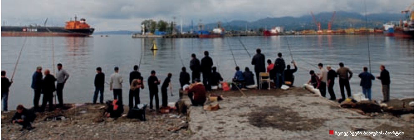
მეთევზეები ბათუმის პორტში