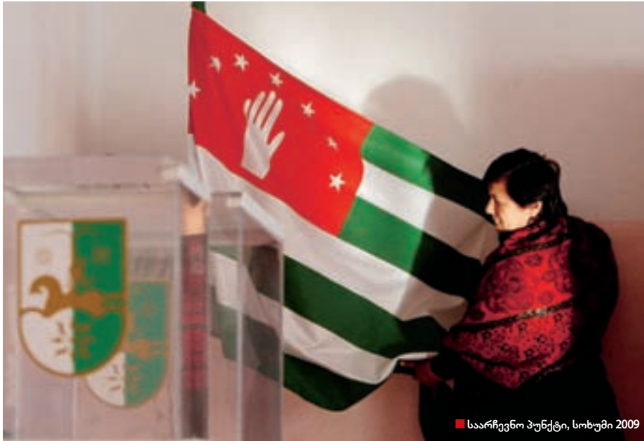
საარჩევნო პუნქტი, სოხუმი 2009