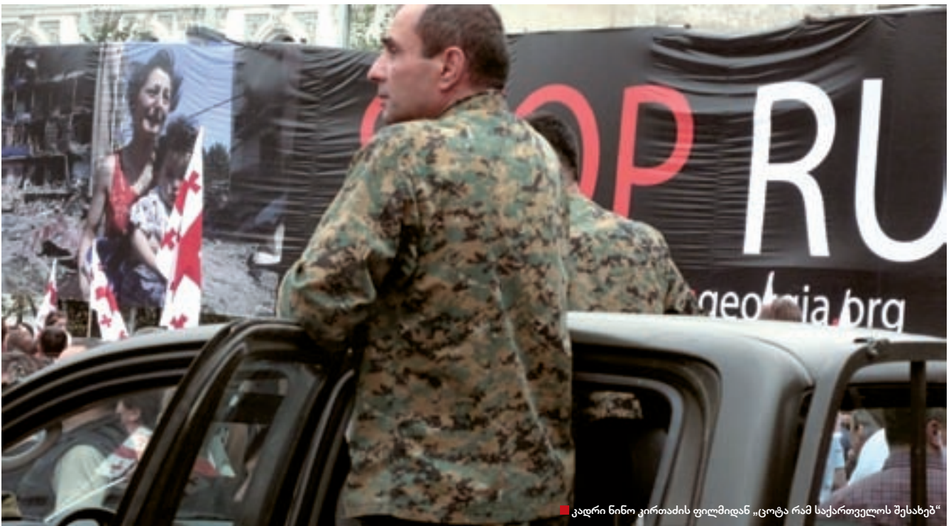
■ კადრი ნინო კირთაძის ფილმიდან „სოტა რამ საქართველოს შესახებ“

ფილმი, რომლის პრემიერაც 12 დეკემბერს, თბილისის მე-10 საერთაშორისო კინოფესტივალის ფარგლებში შედგა, სამონტაჟოდან პირდაპირ კინოთეატრ „ამირანის“ ეკრანზე მოხვდა და მას თავად ავტორმა „ახლად გამომცხვარი“ უწოდა. საინტერესოა, შეიტყო „სოტა რამ“ საკუთარი ქვეყნის შესახებ სახელგანთქმული დოკუმენტალისტისგან, რომელიც ევროპული კინოაკადემიის და პრესტიჟული საერთაშორისო ფესტივალების პრიზების მფლობელია. მრავალრიცხოვანი საფესტივალო თუ სატელევიზიო აუდიტორია, ამ პრიზების გამო, ფილმს უკვე დასრულებამდე ჰყავდა გარანტირებული.