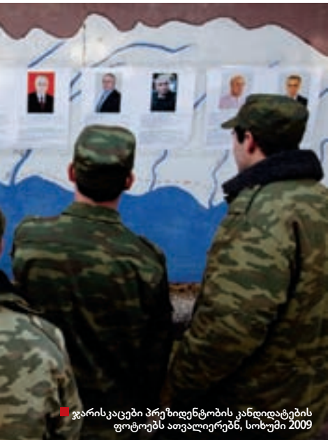
■ ჯარისკაცები პრეზიდენტობის კანდიდატების ფოტოებს ათვალთვლებენ, სოხუმი 2009