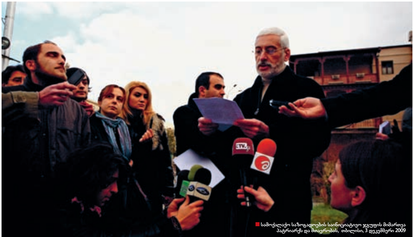
■ სამოქალაქო საზოგადოების საინიციატივო ჯგუფის მიმართვა პატრიარქს და მთავრობას, თბილისი, 3 დეკემბერი 2009