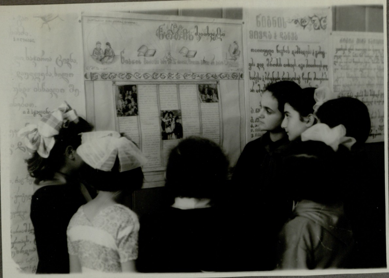
მეზნი ვკითხვარენ კრდნი, ვაწერთან