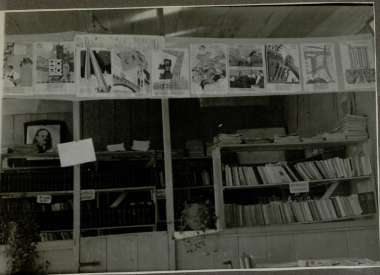
გკითხველები სამკითხველი დასკვნები