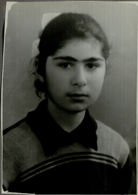
ბ. ხატიანი ლიტ. ნიშნ-ვაჭარი.