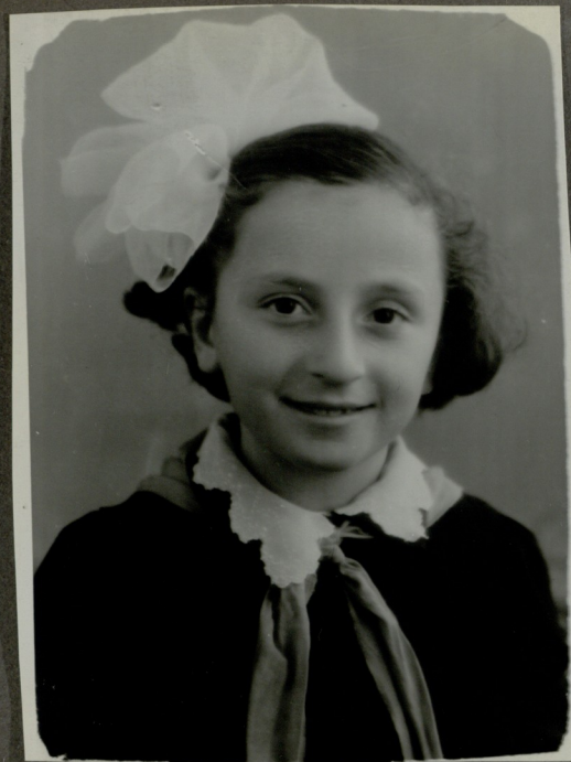
Ը. ԼՅՅՈՒՄՆԵՆՏԵՐ ՏԺ. ԶՅՈՒՆՅՅՐԵՆ