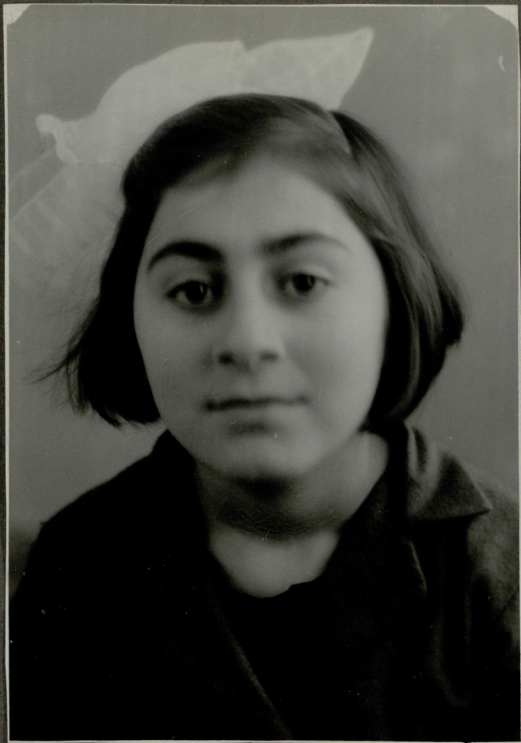
რ. ვარკუნია წიგნის მუშაობის წლის წიგნი