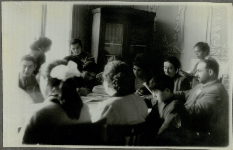
სტუდენტის ვაჭარა საანთმშენებლო განყოფილებაში