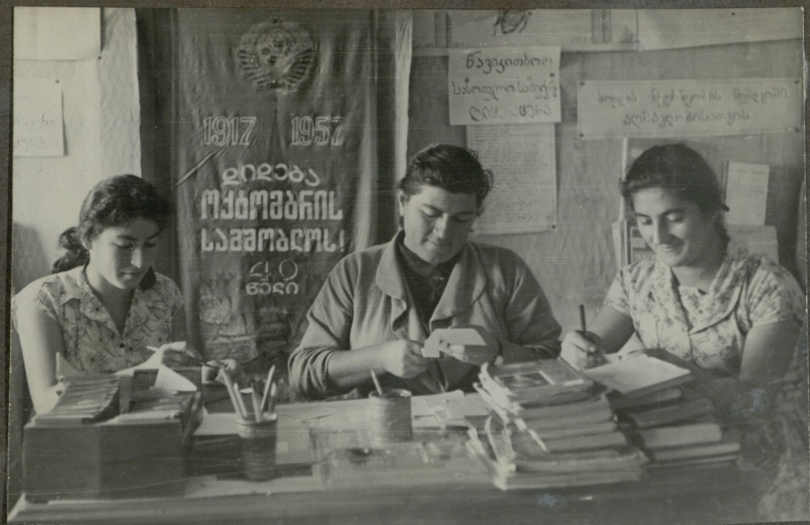
სხადი ნიბნეზის ტექნიკური კაფიტავაზა