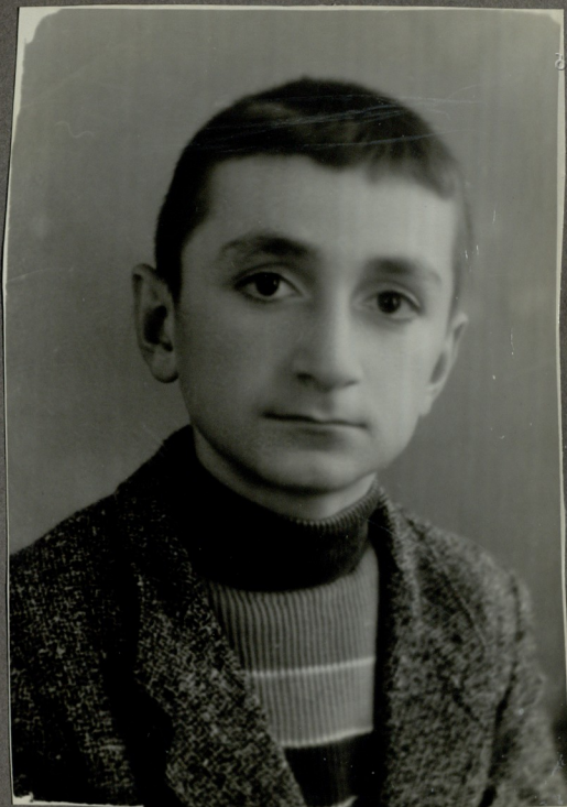
ს. ჭიჭინაძე სწ. მუშაობის წიგნი