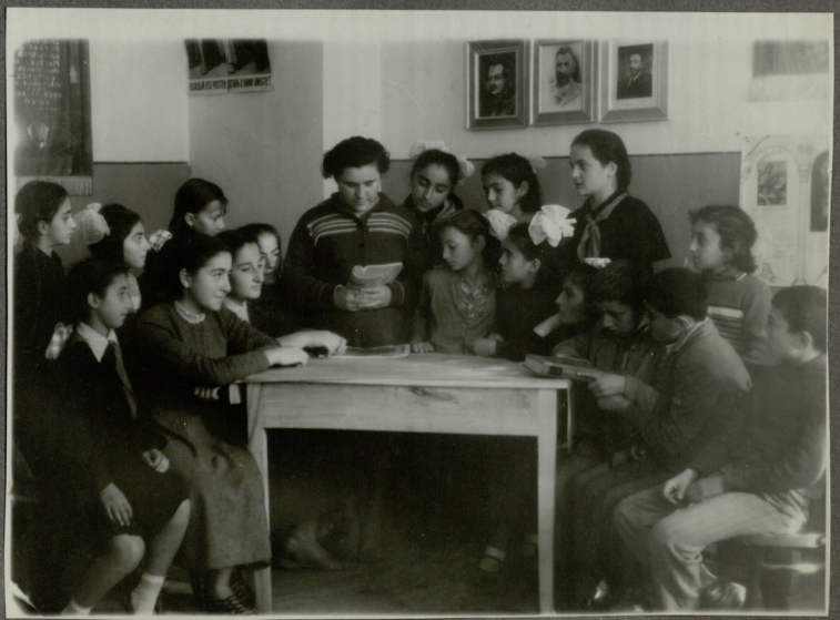
ლიტერატურული წაკილ, მეზანიერთა