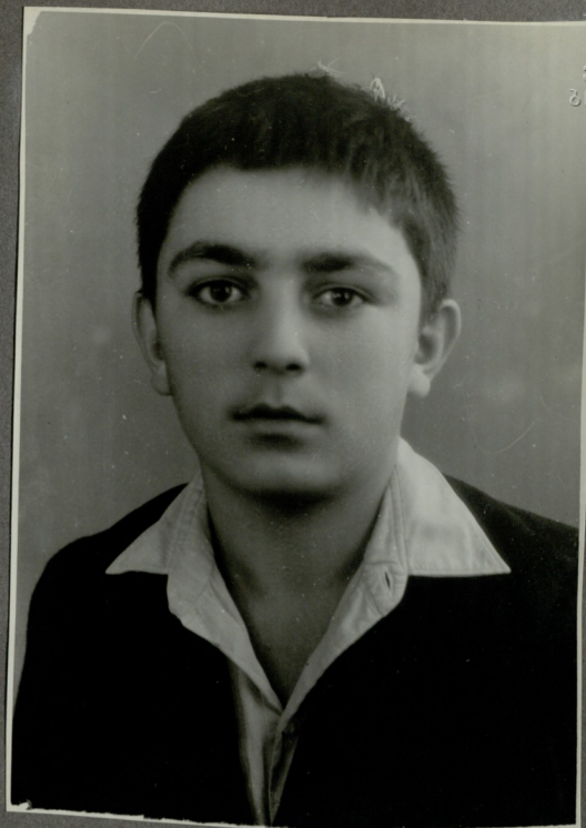
Գ. ՍՄՅԱՅԴ ԸՈՒ. ՆՆՈՆ ՆԳՅՆՈ.