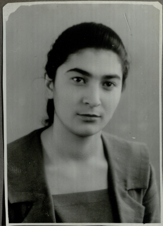
ფ. ლელოანი ნიკოლოზ ბარათაშვილი