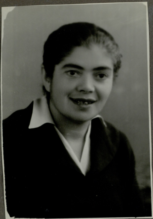
ჯ. ლმთია სახვამოდ ბიბლიოთეკის განაგებ