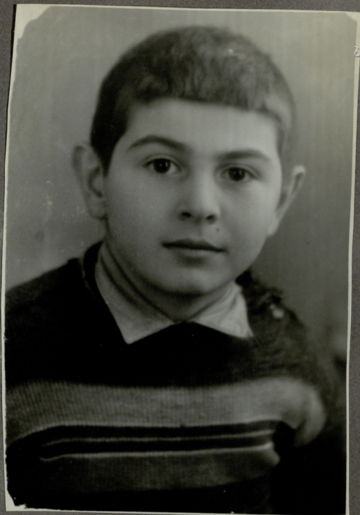
ს. ლომიანი სწ. გ. ბიბლიოთეკა