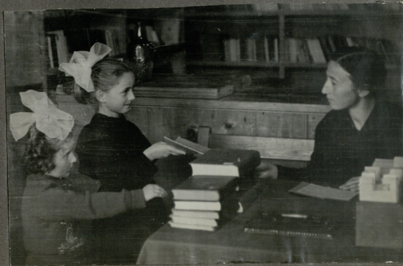
წიგნების ბაზრა ნოტი მკითხველებზე