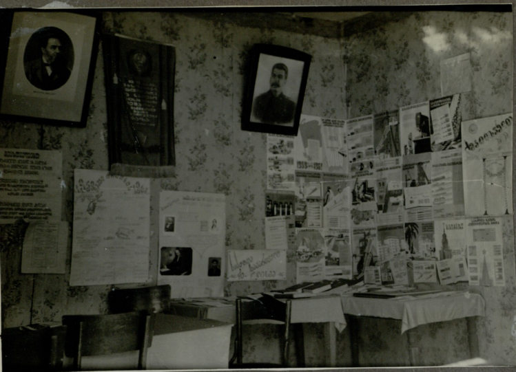
კანოფის საბჭოთა სწავლობის 40 წლისა.