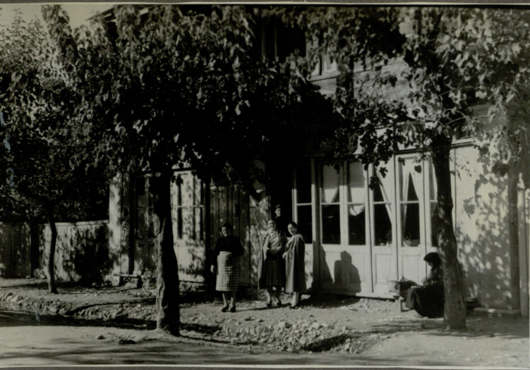
ჭრეხაძის სასოფლო ჰიბლიოთეკა