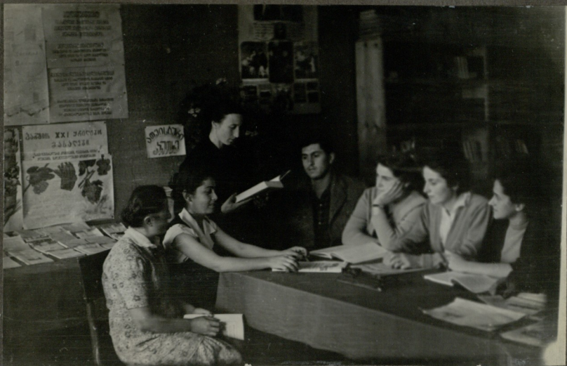
მკითხველებს თავიანთი დასვენების წიგნსაცხადი.