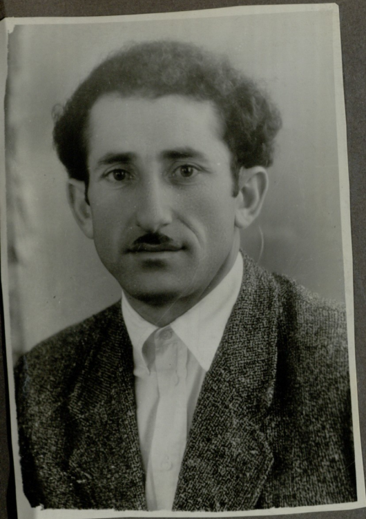
დ. ხვედელიანი (იხე. მე-1) ბიბ. სახელმწიფო ბიბლიოთეკა