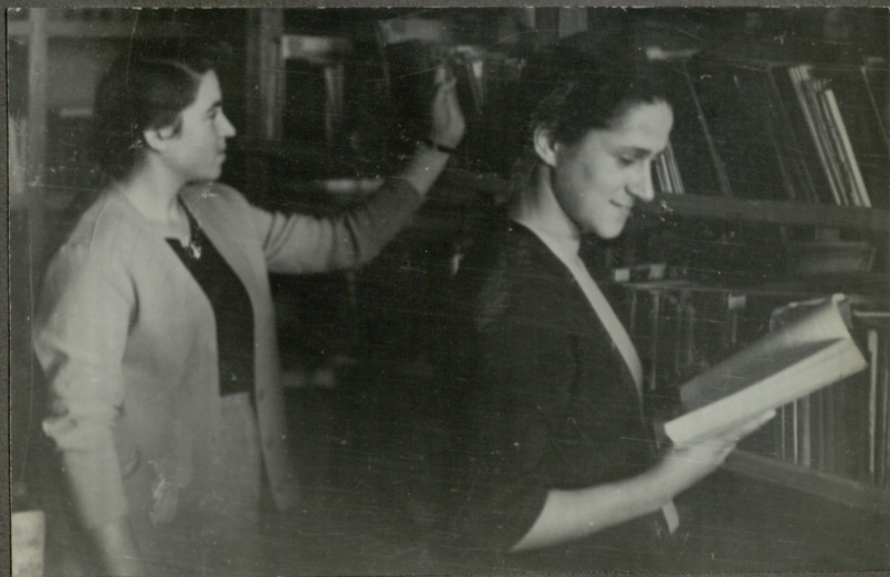
ბიბლიოთეკის სტოვი სემინარულ დახვეწი.