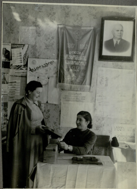
წიგნის პანელა მკითხველზე.