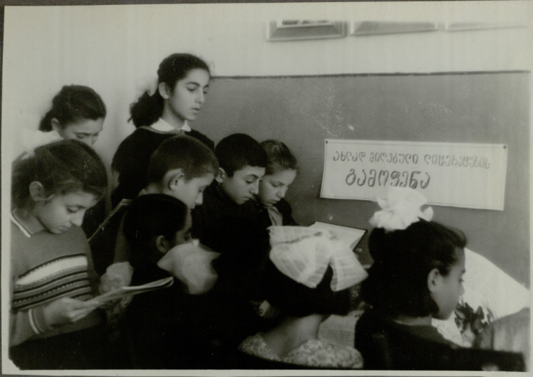
გვიტარებენ ახლად მიღებულ დიქციონარის გამოყენებას