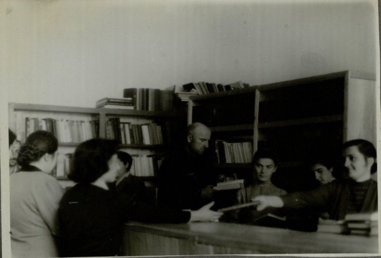
მკითხველები საკანონო ბიბლიოთეკის დანქანებში