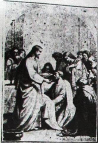
წმიდა ზიარების საიდუმლოს განწესება.

დააეღო წმიდა ბონავენტურას და წმიდა თომა აქვინელს, რომ შეედგინათ საღვთისო საღმრთო მსახურებანი ლიტურგიანში მოსახმარებლად. კიდევ შეადგინეს და ეკლესიაც მას ხმარობს ამ დღისათვის საგალობელთა და სხვა ლოცვათა. კლემენტო და ვენის კრებაზე 1311 წ. გამოაცხადა და დააეღო, რომ მთელ კათოლიკეთა ელღესასწაულთ ყველგან V ყოველწლივ.