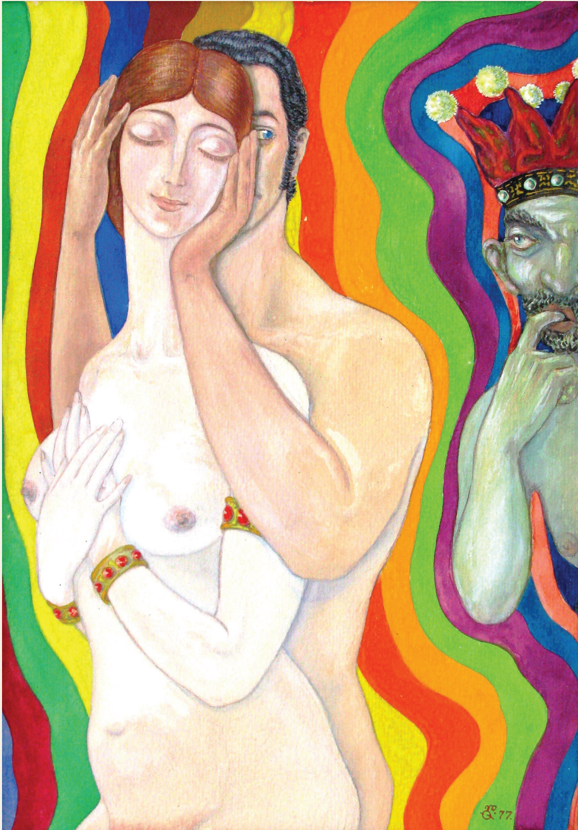
„მასხარა და სიყვარული“. ქადალი, გუაში. 1977 “The Lester and love”. Paper, gouache. 1977