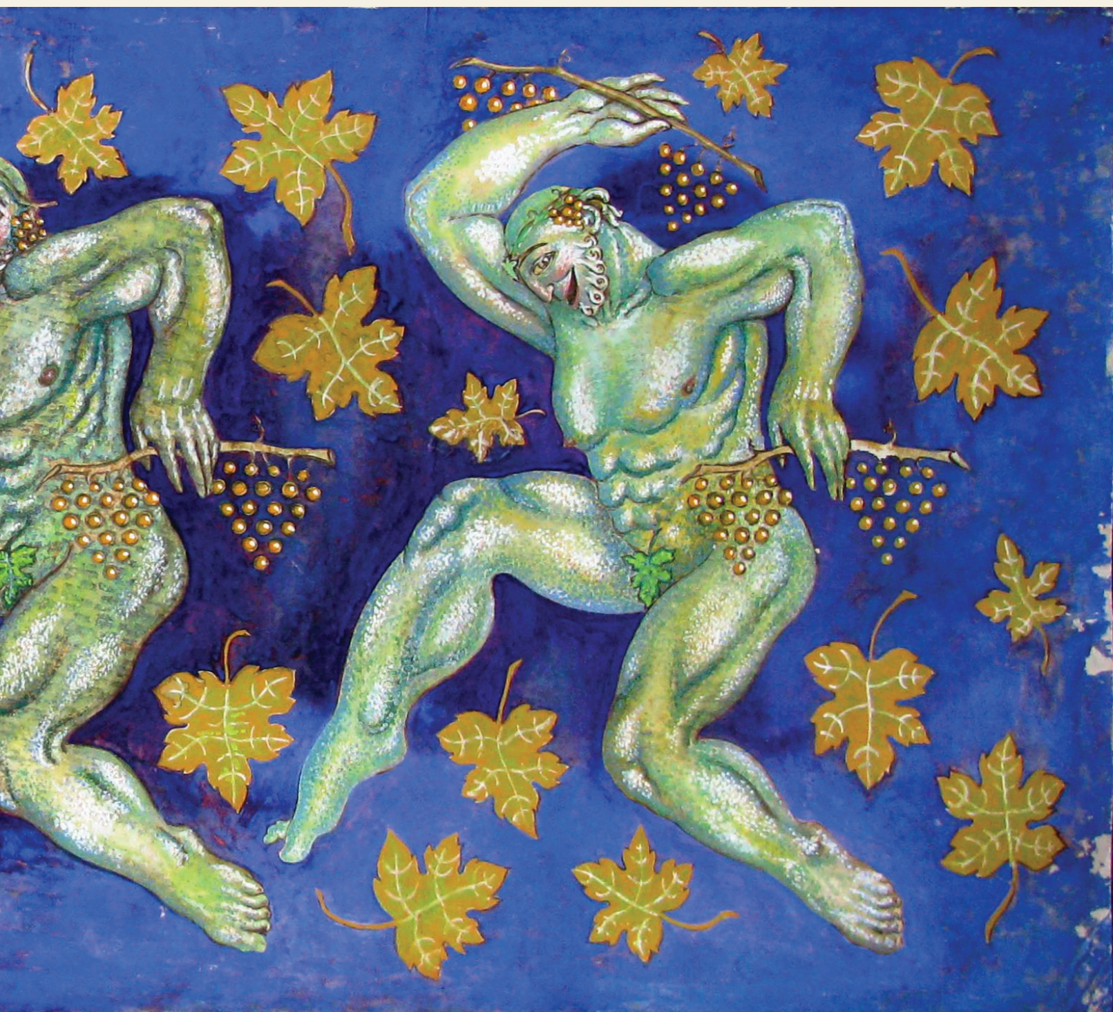
შემდეგი გვერდი: „ბახუსის ცეკვა“. ქაღალდი, გუაში Next page: "Bacchus Dance". Paper, gouache