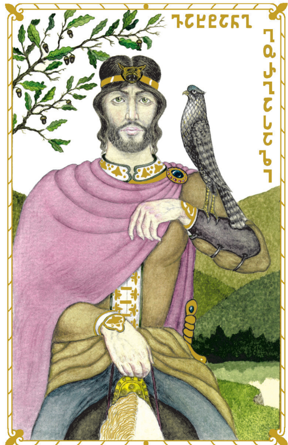
ვახტანგ გორგასალი. ქალაქი, გუაჩი Vakhtang Gorgasali. Paper, gouache