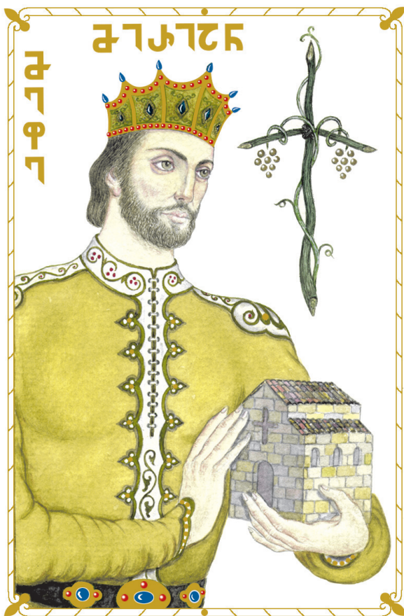
მეფე მირიანი. ქალაქი, გუაჩი King Mirian. Paper, gouache

ია ბაგრატიონ-მუხრანელი ქართველ თავად-აზნაურთა საკრებულოს ვიცე-წინამძღოლი