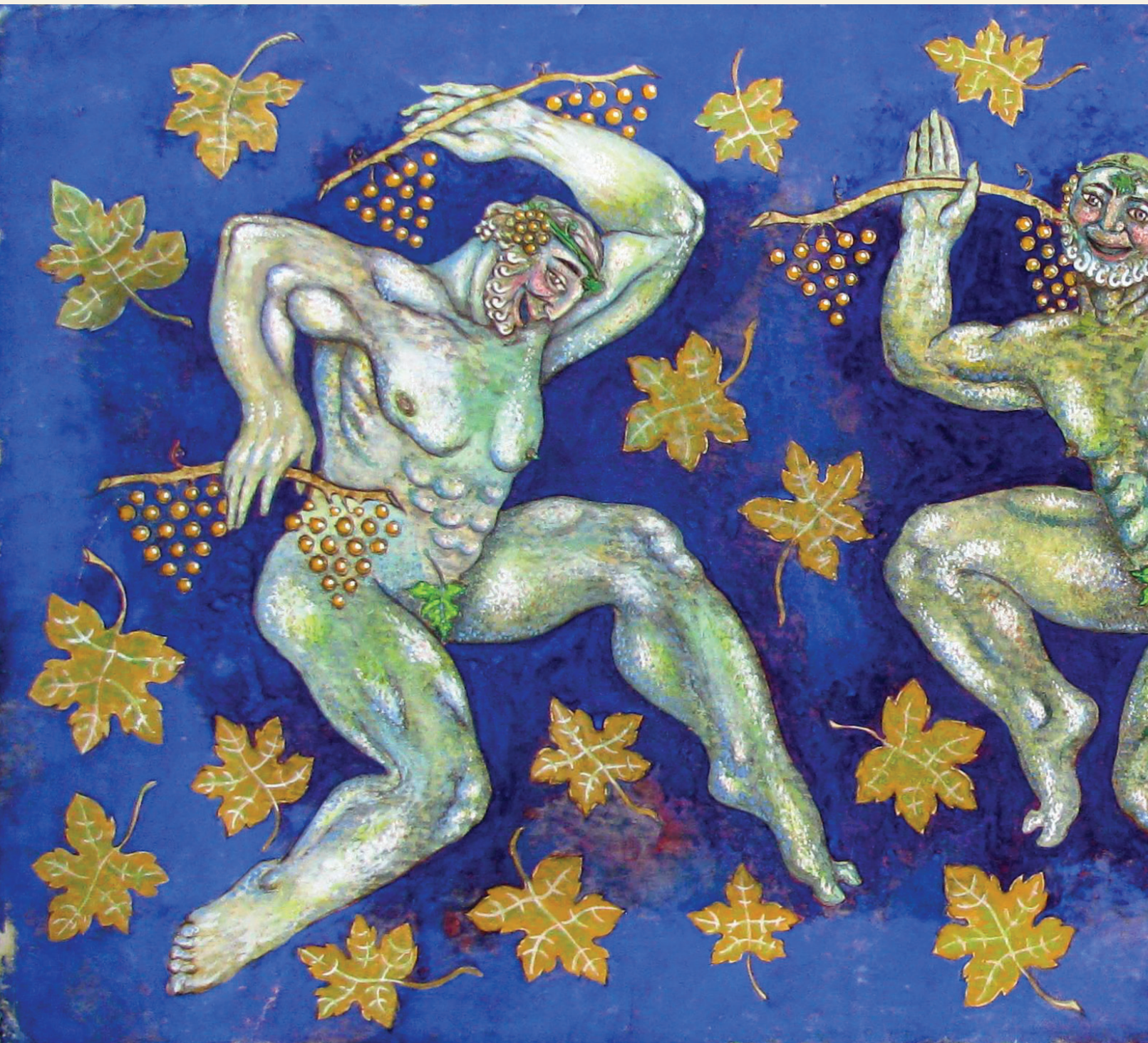
„დიონისეს დღესასწაული“. ქალაქი, გუამი “Dionysus's Fest”. Paper, gouache