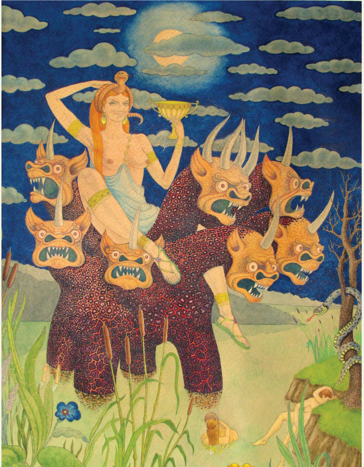
„დედაკაცი შვიდთავიან ურჩხულზე“. ქაღალდი, გუაში. 1992 “Woman on the seven-headed monster”. Paper, gouache. 1992