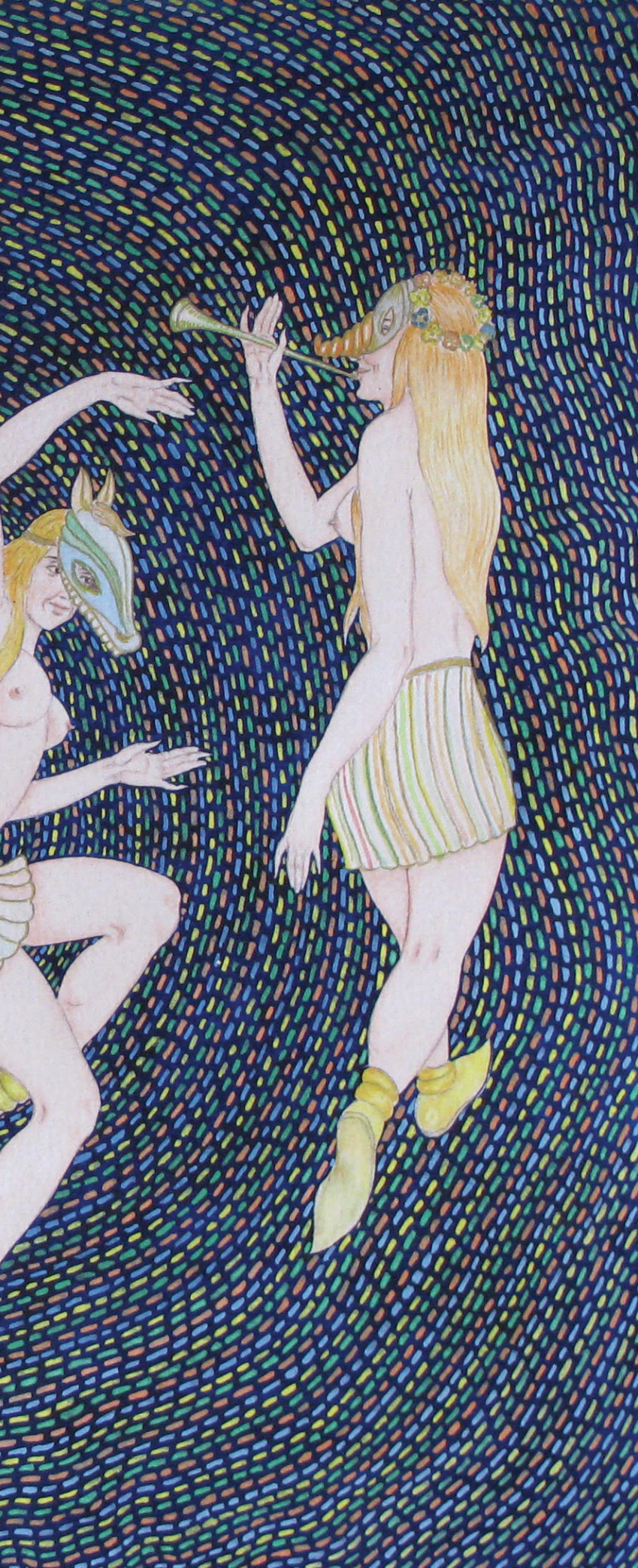
„ბერიკაობა“. ქალაღდი, გუაში “Berikaoba”. Paper, gouache