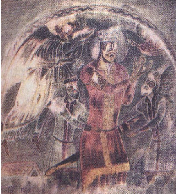
დემეტრე I-ის მეფედ კურთხევა.

მოვლა და შენარჩუნება წარმოადგენდა. თავდაპირველად, 1128 წელს, მან „ღმანისი და ქალაქი ხუნანი სპარსელებს წართვა“. 14