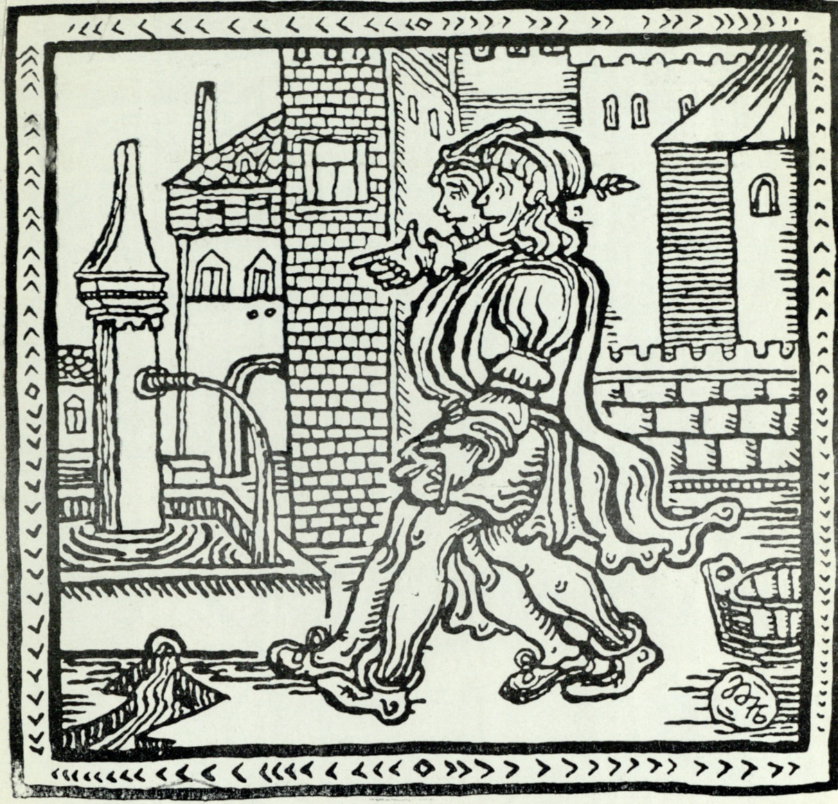
უ. შექსპირი „ორი ვერონელი“. ილუსტრაცია У. Шекспир „Два веронца“. иллюстрация

კინოსტუდია „ქართული ფილმი“ ტუში, აკვარელი 51x71 ავტორის კვანძი პიტილი 1971 ტუში, გუაში 29x57 საქ. სახ. სურ. გალერეა. ბ. აბაბაძე ზვიდი ლეკი 1980 ტუში, გუაში 20x15 ავტორის კვანძი „დარისპანის ბასპირი“ თბილისის რუსთაველის სახ. აკად. თეატრი განხორციელებული სპექტაკლი 1971 კოლაჟი 32x51 საქ. სახ. სურ. გალერეა. ო. თორთაძის „ორი ნოველა“ თბილისის ოპერისა და ბალეტის თეატრი 1967 ტუში, აკვარელი 23x63 ავტორის კვანძი სულხან-საბა ორბელიანი „სინაპის სინაპისა“ 1981 გუაში 21x27 ავტორის კვანძი ბ. აბაბაძე ესკიზი ბალეტისათვის „მანკის სახელმწიფო“ თბილისის ოპერისა და ბალეტის თეატრი 1981 გუაში