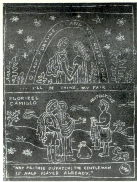
უ. შექსპირი „ზამთრის ზღაპარი“ ილუსტრაცია У. Шекспир „Зимняя сказка“ иллюстрация

იათა ხუთსი „შუშანიკის წამება“ 1975-1976 გუაში 27x26 ავტორის კვანძი „შუშანიკის წამება“ რეკლამა 1980 ტუში 21x17 ავტორის კვანძი „რუსულადანიანი“ ქართული ეპოქა ახალი ეპოქა 1975 გუაში