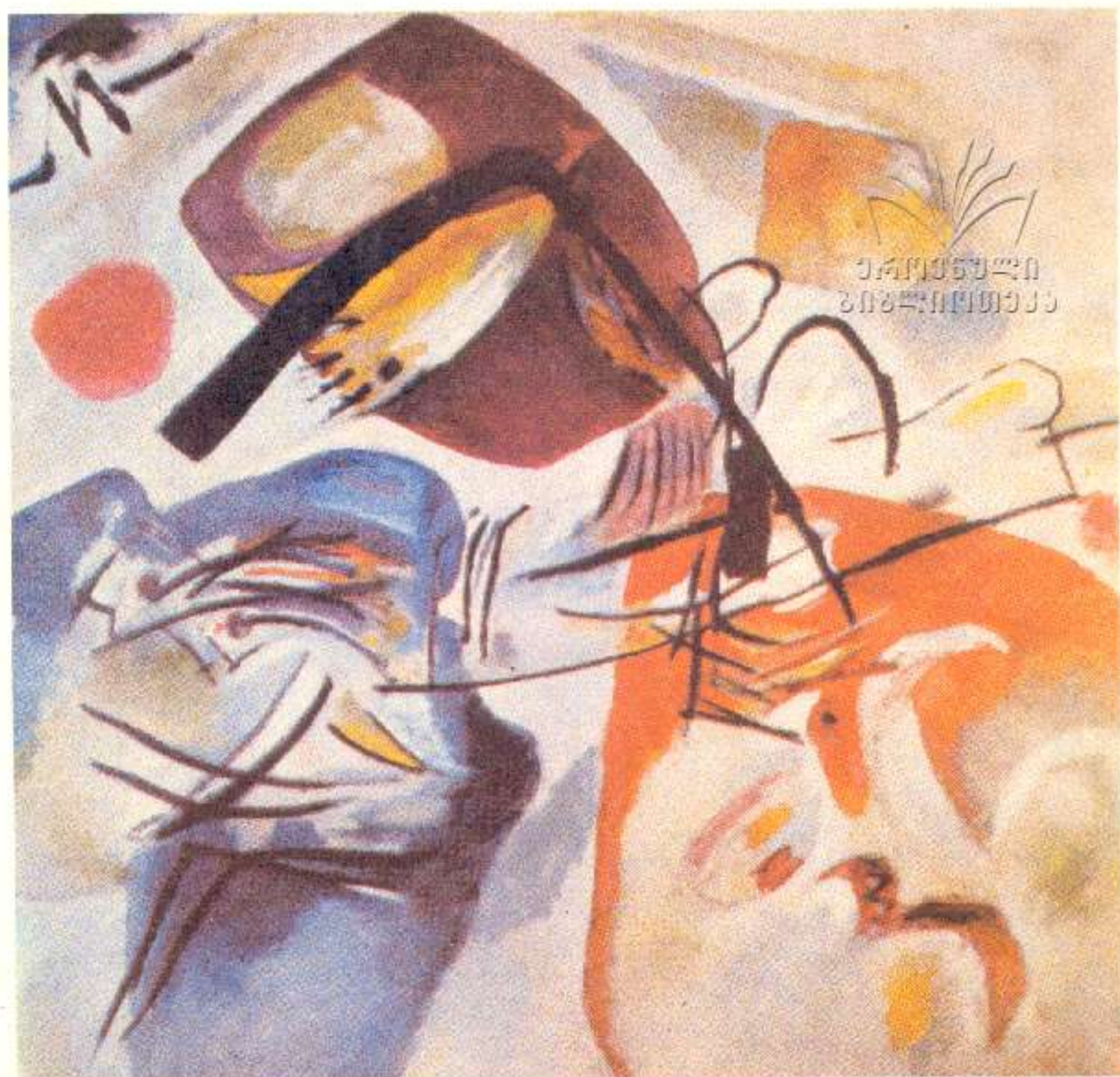
ვასილი კანდინსკი. შავი კამარით.