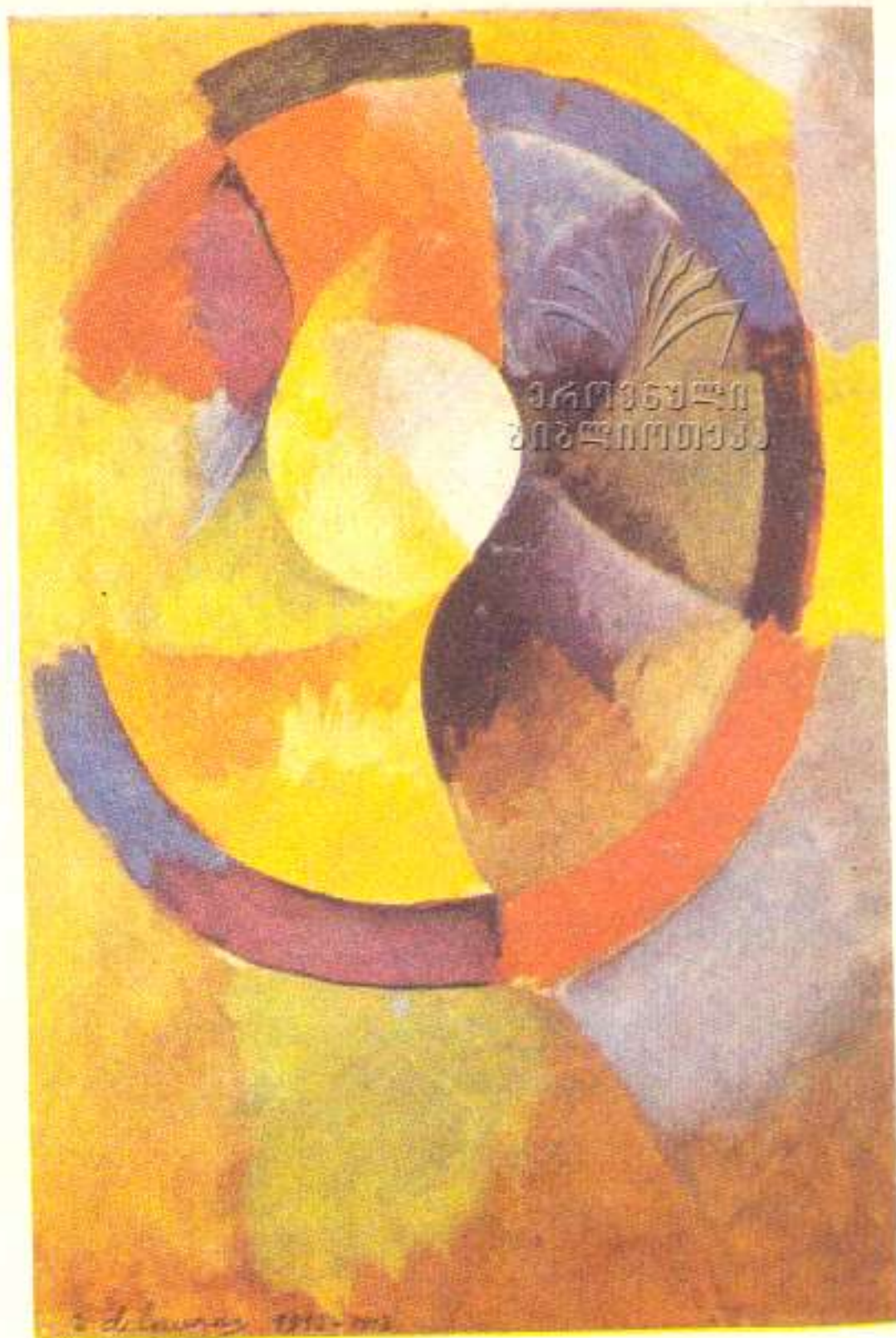
რობერტ დელონე. წრიული ფორმები.