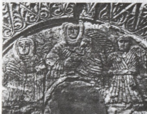
ვალეს ეკლესია. აღმოსავლეთის ფასადის რელიეფი. ღვთისმშობელი

როგორი იყო მოსახლეობის რიცხოვრივი შემადგენლობა მესხეთში ომამდე? როგორი ცვლილებები მოხდა მასში ომის შედეგად, განსაკუთრებით რუსეთთან შემოერთებულ სამცხე-ჯავახეთში?