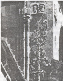
სვეტიცხოველი. დასავლეთის ფასადის რელიეფი

ისტორია ცნობიერების დონე ისტორიის, სოციოლოგიის და მორალის საკითხებში. ასე ხელოვნურად აბუნდონებდნენ ისედაც გაუნათლებელი გლეხობის აზროვნებას, სპობდნენ რა ფესვებში მათ ნაციონალურ თვითშეგნებას. ეს არ იყო ერთეული შემთხვევა, ეს იყო მესხ ქართველ მაჰმადიანთა საკუთარი ეროვნებისგან გამიჯვნის თანმიმდევრული პოლიტიკა, მათი განწირვა დეგრადაციისა და სიბნელისთვის. ასეთსავე პოლიტიკას ასორციელებდნენ სხვადასხვა რესპუბლიკებიდან მესხეთში საპასუხისმგებლო პოსტებზე სამუშაოდ გამოგზავნილი შემთხვევითი პიროვნებები. ისინი წარმოადგენდნენ მხოლოდ რელიგიური ნიშნის მიხედვით გამოგზავნილ ინდიფერენტულ კარიერისტებს და ხალხის მშობლიურ ისტორიაში უხეშად ჩარეულ უცხო ძალას. მრავალი წლების განმავლობაში ამ ხელოვნურად შექმნილმა მეტად დაძაბულმა ატმოსფერომ, თავიდან დააჩლუნგა მესხ ქართველ მაჰმადიანთა ნაციონალური თვითშეგნება, რომლის შესახებაც მათ არასოდეს არავინ ეკითხებოდა და შემდეგ კი აიძულა, დაევიწყებინათ ვინ არიან და რანი არიან? რომელ ეროვნებას წარმოადგენენ და ფიზიკურად რომელ ტიპს განეკუთვნებიან? რომელი დროიდან ცხოვრობენ ისინი ამ მიწაზე და რა დამოკიდებულება აქვთ მათთან, ვინც ამ მიწაზე ოდესდაც შექმნა საფარა, ზარზმა ან წუნდა, ააშენა აწყურის, ხერთვისის ან თმოგვის ციხეები. დიდებული წინაპრების ეს მემკვიდრენი ნაციონალური გულცივობის დაჩლუნგებულმა ატმოსფერ-