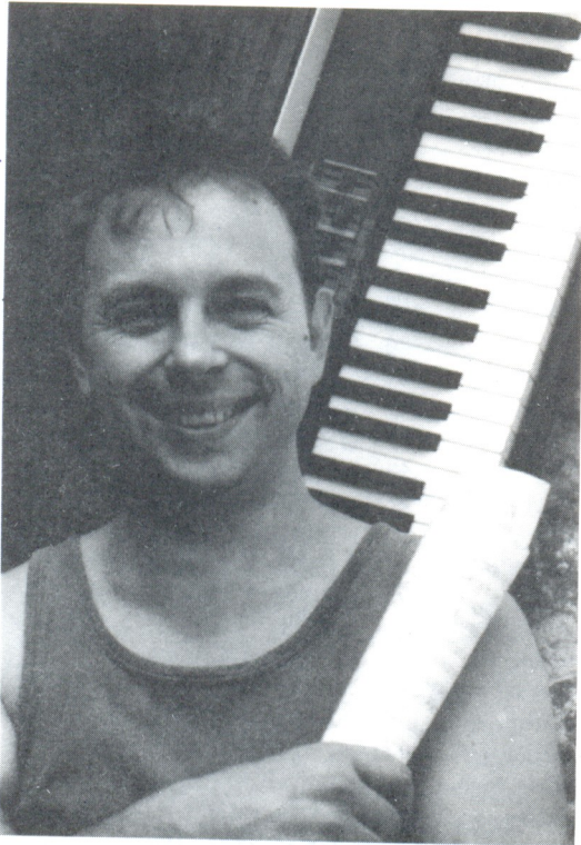
En collaboration avec la Ligue des Professionnels de Géorgie

(ბილეთები იყიდება დიდი დარბაზის საღაროებში, ფასი: 2 - 15 ლარი)