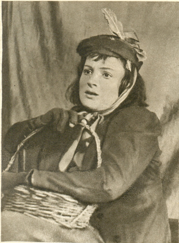
ბერნარდ შოუ «პიგმალიონ» ელიზა დულიტლ — მ. ჯაპარიძე