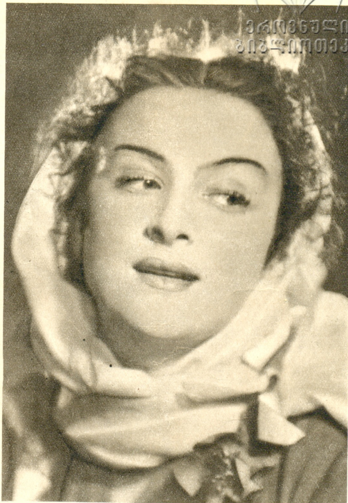
Важа Пшавела «Изгнанник» Гулсунда — М. Джaparидзе