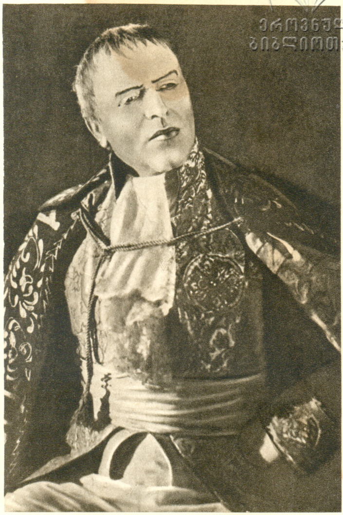
სარდუ ი მორე «მადამ სან-ჟენ» ფუიე — პ. კობახიძე