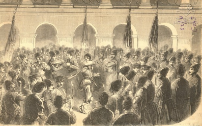
Illustration published in Le Courrier de la Ville .