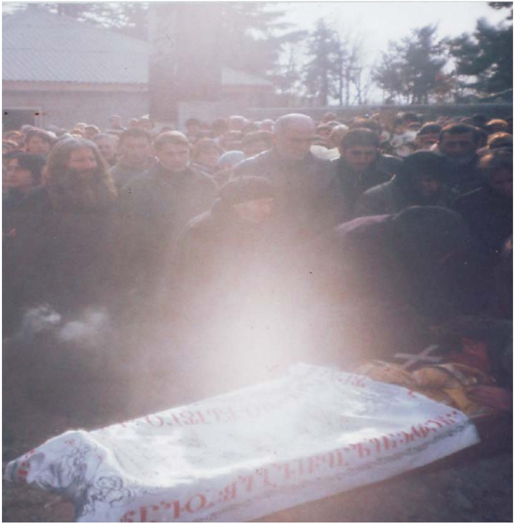
დაკრძალვის წინ მის ცხედარს ნათელი დადგა