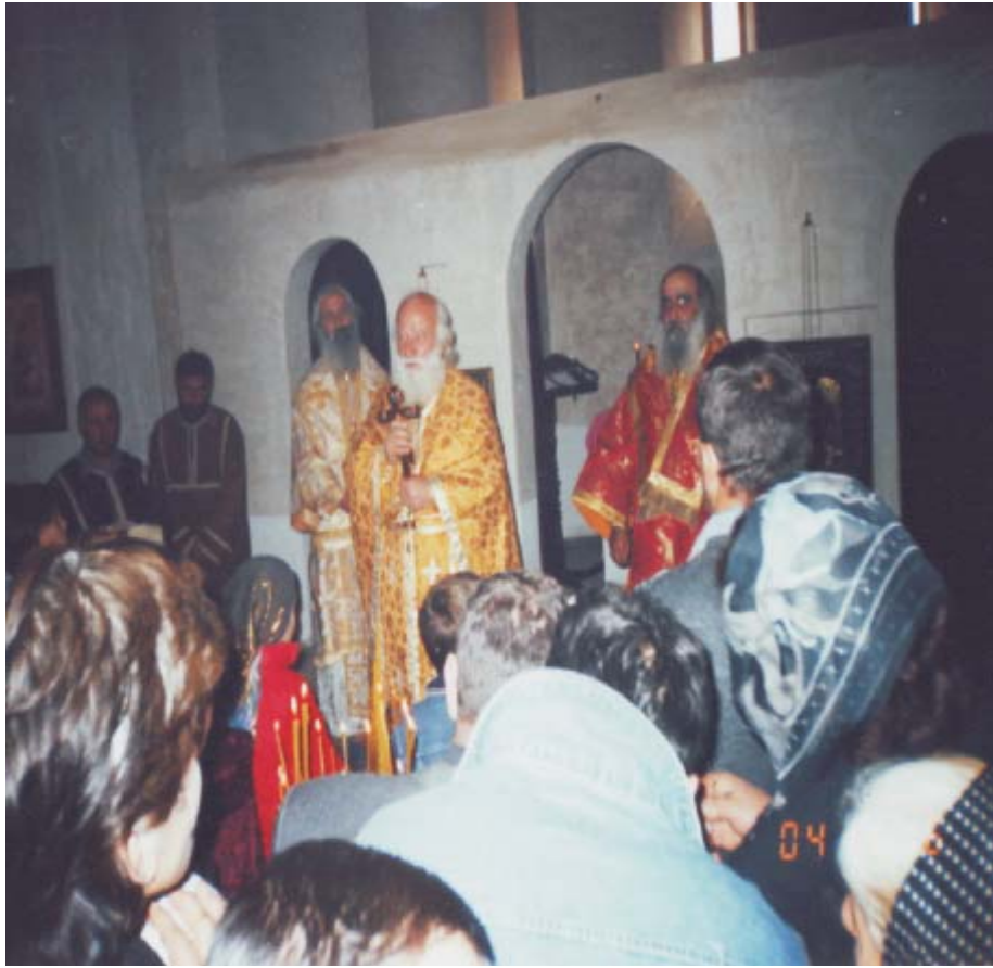
მთავარანგელოზთა სახელობის ტაძრის კურთხევა