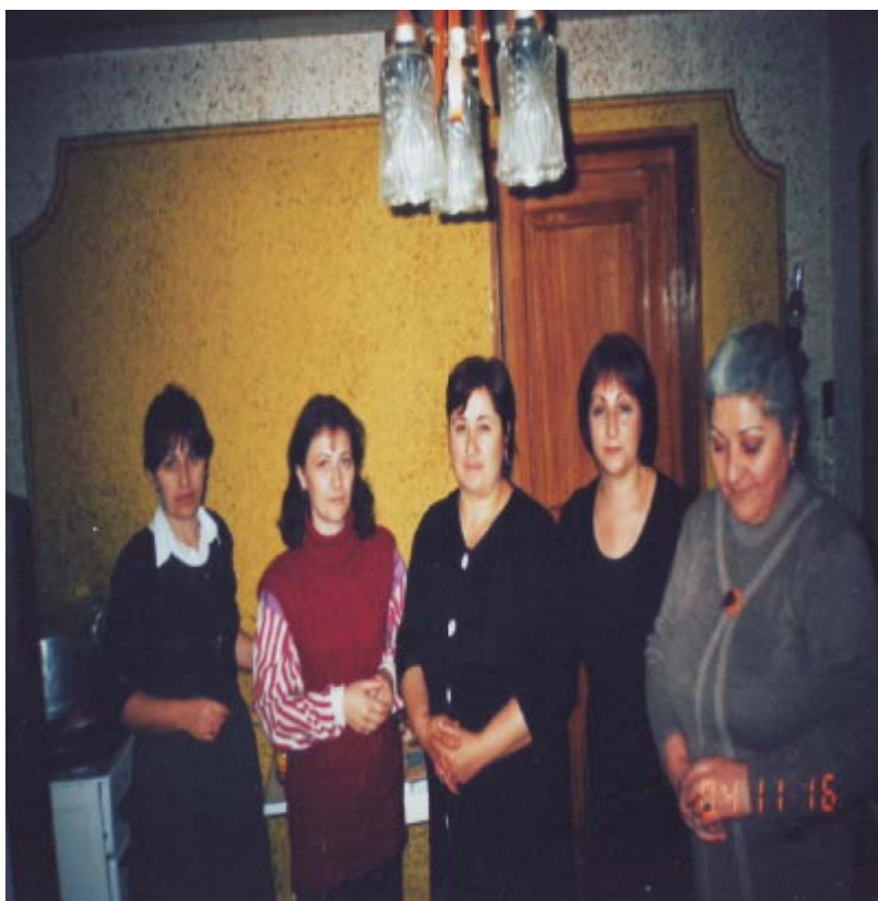
მრევლის წევრები ტრაპეზის მომზადებისას