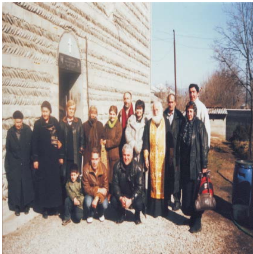
მწერალთა კავშირის თავმჯდომარის სტუმრობა სართიჭალაში