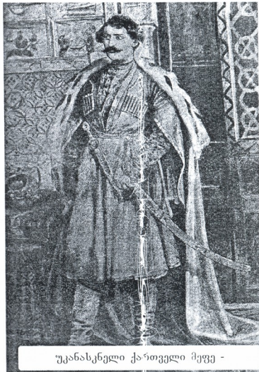
უკანასკნელი ქართველი მეფე -

ასეთ სიტუაციაში დამღუპველი იყო ქართული სამეფო-სამთავროების დაქსაქსულობა და ურთიერთდაპირისპირება, რადგან რუსეთი თვითოეულ მათგანს სათითაოდ უღებდა ბოლოს. საჭირო იყო გაერთიანებული ძალებით დახვედროდნენ მოახლოებულ საფრთხეს. სოლომონ მეფე ცდილობდა რუსეთთან ურთიერთობაში მთელი დასავლეთ საქართველოს სახელით გამოსულიყო... ქართული სამთავროები შემომტკიცებინა, სამეფო გაემძირებინა, საზღვრები განემტკიცებინა. გურიის მთავარი კი აღიარებდა მის უზენაეს ხელისუფლებას, მაგრამ სამეგრელო დიდ წინააღმდეგობას უწევდა.