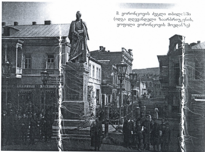
მ. ვორონცოვის ძველი თბილისში (იდეა დღევანდელი ზაარბრიუკენის, ყოფილი ვორონცოვის მოედანზე)

აღსანიშნავია ისიც, რომ ამ პერიოდში იწყება ფეოდალური საკუთრების თანდათან მოშლა, დაჭირავებული შრომის შედარებით ფართოდ გამოყენება, სამრეწველო უჯრედების შექმნა, საქართველო თანდათან ებმება კაპიტალისტური განვითარების ორბიტაში. ერთი სიტყვით, დაიწყო ძველი სოციალ-ეკონომიკური ფორმაციის რღვევა. ვორონცოვმაც აღლო აულო ვითარებას, იგი ესწრაფოდა დაჩქარებულიყო რუსეთის ერთიანი ეროვნული ბაზრის ორბიტაში საქართველოს ჩართვა, მის ნაწილად გადაქცევა. სწორედ ამას ისახავდა მიზნად, და არა საქართველოზე ზრუნვას, მის მიერ გატარებული ის ღონისძიებები, რომლებიც სავაჭრო გზების გაყვანით, რუსი კაპიტალისტების მოწვევით, სოფლის