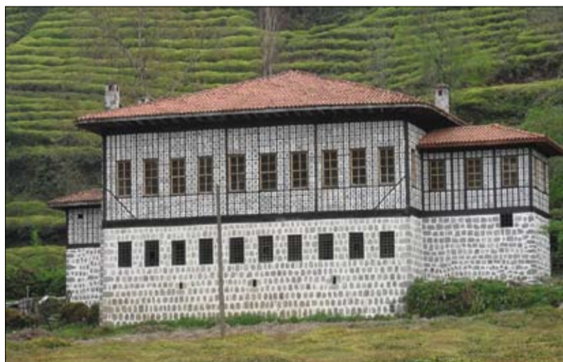
ლაზი თაველის სახლი