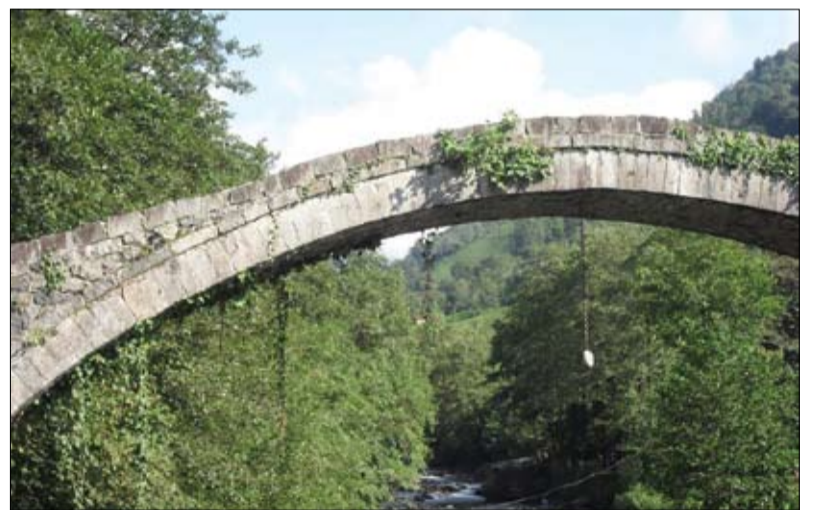
ხიდი სოფელ აზუში