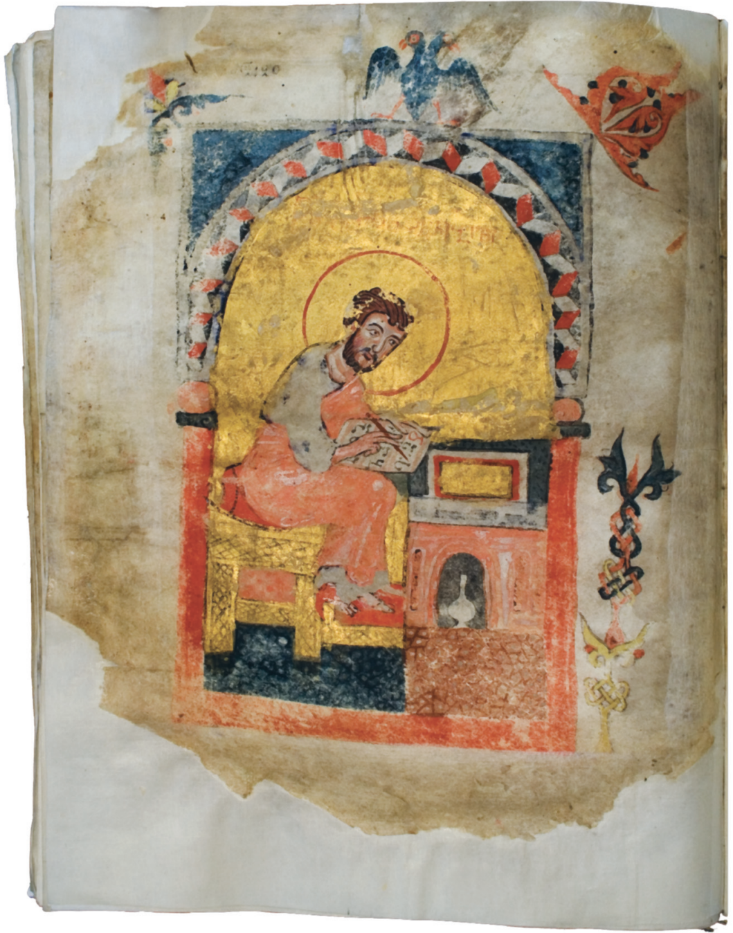
№№ 2-3. Из Пицундского грузинского четвероглава. Изображение евангелиста Марка и фрагмент текста евангелиста Луки (XII в.).