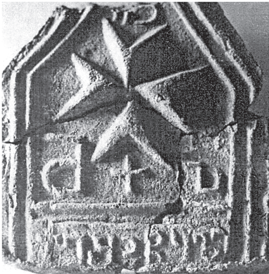
№ 6. Грузинская надпись из церкви архангела Михаила на горе Мсыгхуа Гудаутского района (IX в.);