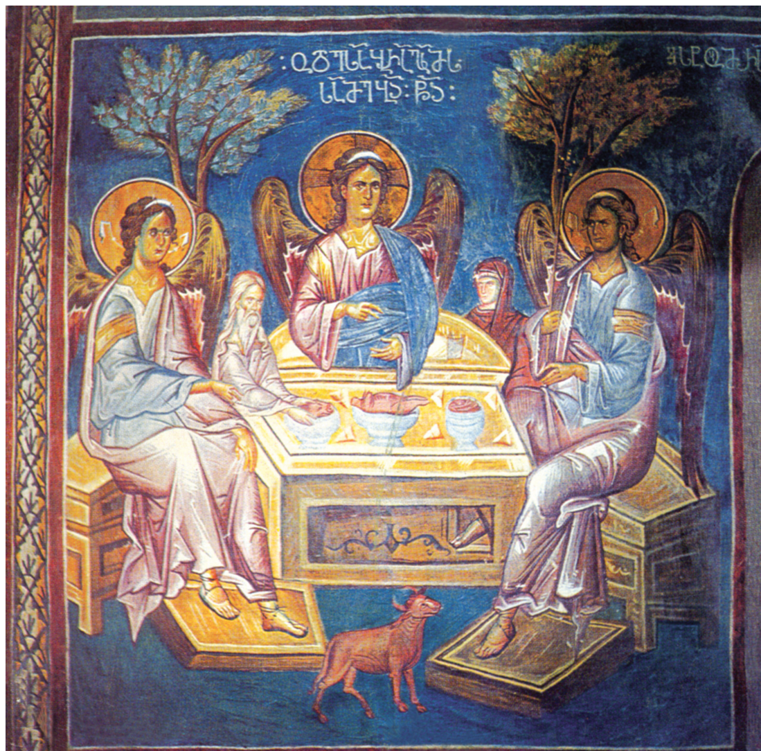
№ 1. Лыхненский храм (Гудаутский район Абхазии). Святая Троица с грузинской надписью (XIV в.).