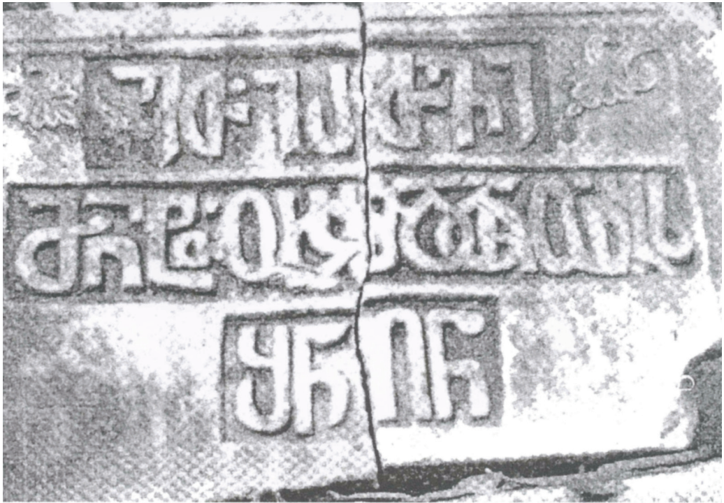
№ 9. Село Члоу (Очамчирский район). Грузинская надпись эриставт эристава Одиши (Мегрелии) и мандатуртухусеса (примерно, министр внутренних дел) Грузии Озбега Даддани (середина XV в.).