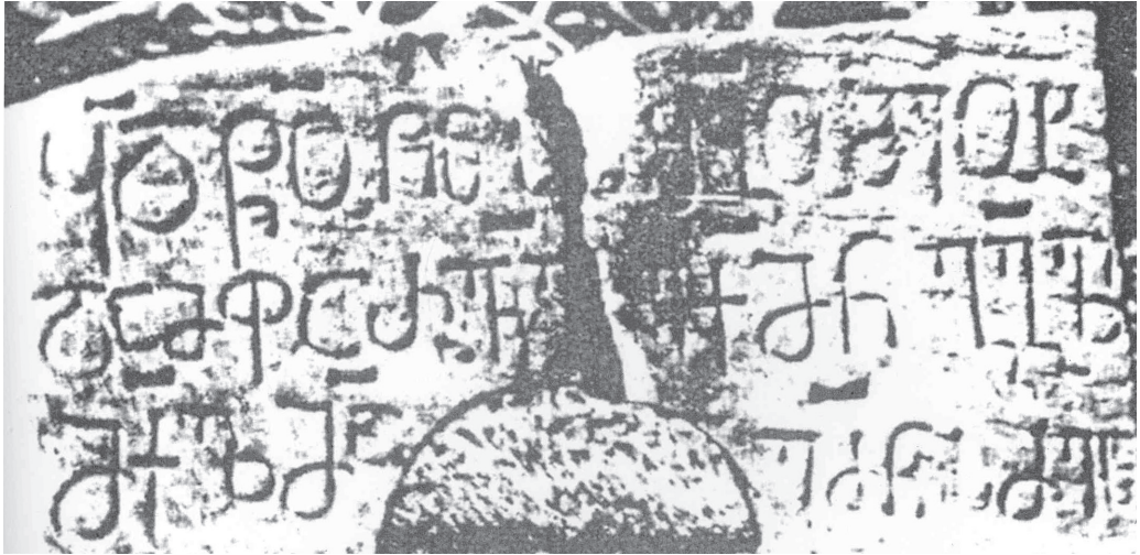
№ 7. Село Мокви (Очамчирский район). Грузинская надпись Григола Моквели на каменной плите Моквского храма (XII в.).