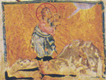
№№ 4-5. Из Моквского (Очамчирский район Абхазии) грузинского четвероглава (1300 год).

Handwritten marginal note in Georgian script.