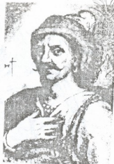
ვახუშტი III დადიანი