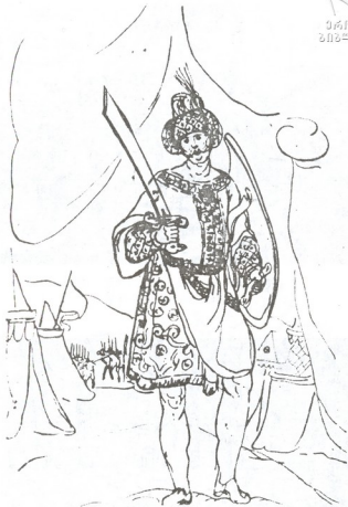
როსტომ მეფე (1632 - 1658).