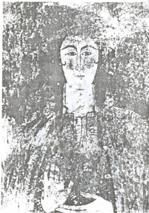
მარიამ დადიანი (ვათხოვებამდე). წალენჯიხის გაძრის ფრესკა. მე-17 საუკუნის 20-იანი წლები.