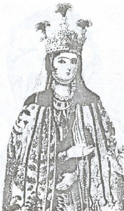
დედოფალ მარიამ დადიანის პორტრეტი, შესრულებული სვეტიცხოვლის ურესკიდან გრიგორი ვაგარინის (1810 - 1893) მიერ.