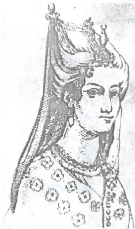
ქრისტეულო და კახელი (1597 - 1659). მარიამ დადიანის პორტრეტი.