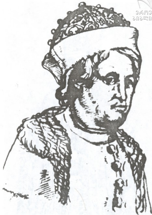
ქრისტოფორო დე კასტელი (1597 - 1659). ოდიშის მთავარ ლევან II დადიანის პორტრეტი.