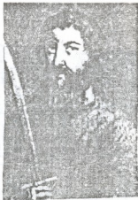
მუჟე აზიზი II