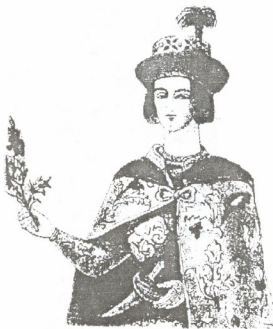
მარიამ დედოფლის შვილის ოგია გურიელის პორტრეტი, შესრულებული გრიგორი ვაგარინის (1810 - 1893) მიერ სვეტიცხოელის ფრესკიდან.