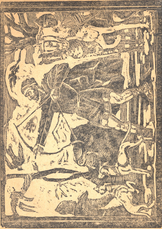
ვახტანგის ნადირობა გოგირდოვან შუგროებთან და ქ. თბილისის დასაწყება