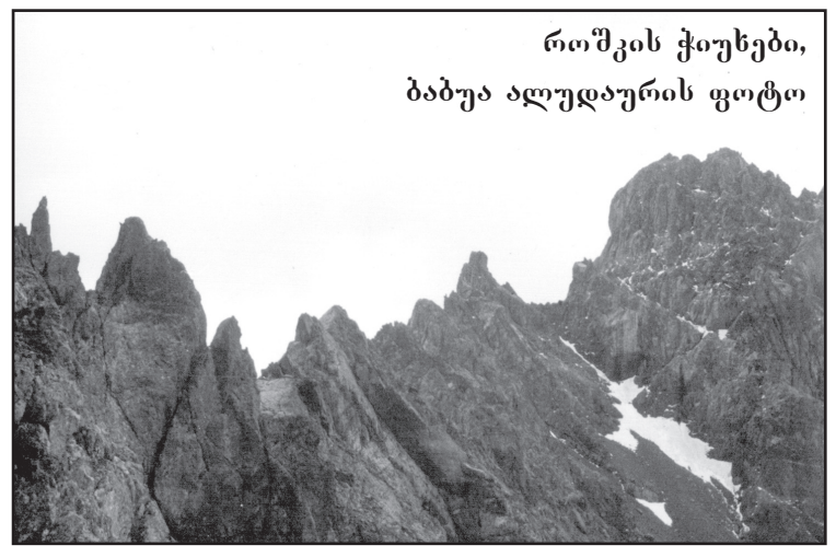
როშის ქიხები, ბაბუა ალუდაურის ფოტო