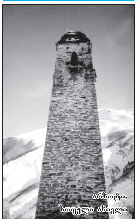
ანსოტი, სოფელი მსიელი