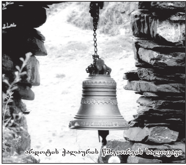
არდოტის ქალაურის წმ. გიორგის საფლავი