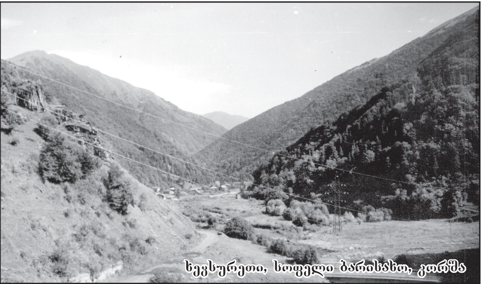
ხევსურეთი, სოფელი ბარისასო, გთმშბ

აქ კუსტარულად ჭედდენ სახნის-საკეთილებს, დანა-ურსებს, თლიდნენ უღლებს, საფარცხველებს (ხეც. ფოცხი), ჯარა-ტაგურეებს, შენდებოდა საღვთო-გომურები, ჯვარ-ხატები, ციხე-ქავეები.