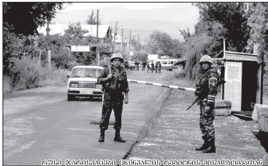
რუსი ჯარისკაცები ცხინვალის რეგიონის მესაზღვრეებთან

გაზაფხულზე ააფეთქეს ნიკოლაევის ხიდი რაჭა-ლეჩხუმიდან მამისონის უღელტეხილისაკენ. ქართველმა მესაზღვრეებმა კი უკან დაიხიეს სამხრეთისაკენ 20 კილომეტრით, მოაწყვეს ახალი პოსტი სოფელ გლოლის მახლობლად.