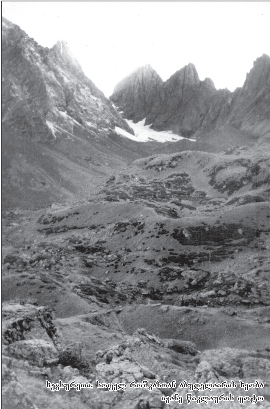
სევსურეთი, სოფელ რაშკასთან აბუდელაირის სეობა

როგორ ავმდერდი, როგორ ავფეთქდი, გადამსკდა მკერდზე ღიღი-კაბანი, ამ გაზაფხულის ლორთქო კვირტებით გავბრუნებულვარ იასამანი. ძარღვებში დამდის რქე და მირონი სისხლად, რომ უფრო უნდა ვიპოო, რომ ღურჯი ზეცის სანაპირონი ჩემი სურნელით დაგატრიალო. ფოთლები კრთიან ღამენათევი, მაქვს აიაზმით შუბლი ნაბანი, და მზის სხივივით ვარ ბედნათელი სიცოცხლით საგვ იასამანი. ქარი მაქანებს აღმა და დაღმა, სულ დამაწყვითა ღიღი-კაბანი. ღიმი მაჩუქე, ცაგ, ერთი ღიმი, შენთვის ავფეთქდი იასამანი.