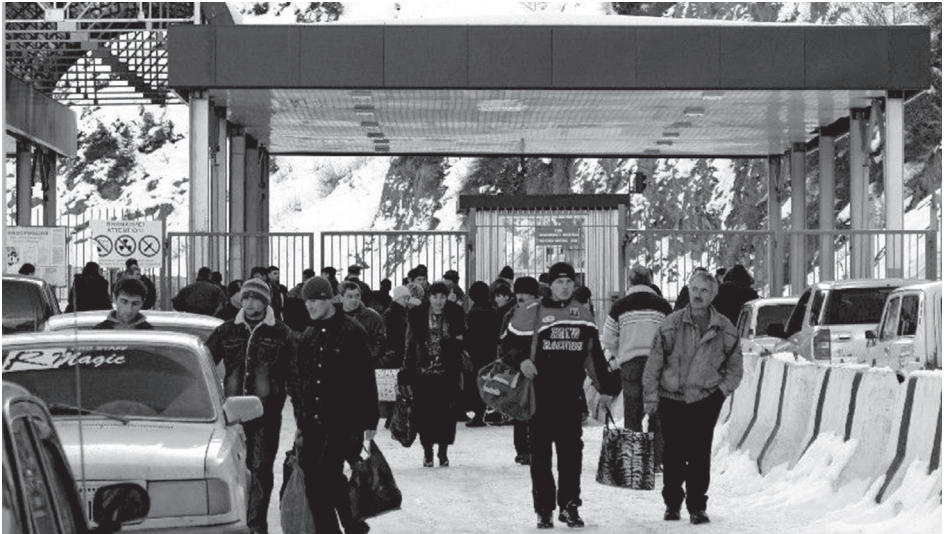
რიონულ ნაბიჯებს დგამს.