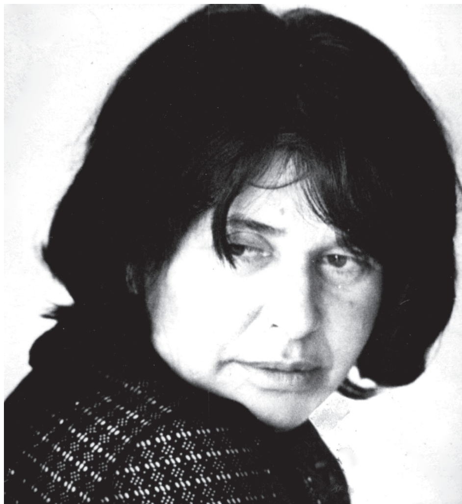
დიდებული პოეტის ხსონას, მის შემოქმედებას.