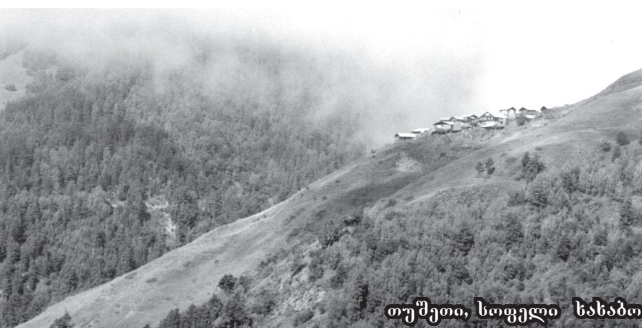
თუშეთი, სოფელი ხანახანი

სტუმრად ვარ სოფელ ლალისყურში, სადაც კახელებთან ერთად თუშებიც ცხოვრობენ: ჯვრტიბები, ირუაიბები, ხარბიბები, ბუქაიბები, ფიცხელაურები, სენიაიბები, ღულაღაურები და ვინ აღარ. ამ ლამაზ ისტორიულ სოფელში, რომელსაც თამარ მეფემ ლალისყური უწოდა, ბევრი მეცხვარე მგულებ