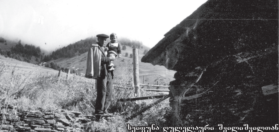
სეიფუნა ღულაღაური შვილიშვილიან

ბოლა, თუმცა ბოლო ხანებში მათი რიცხვი საგრძნობლად შემცირდა. ზოგიერთებმა თავი მიანებეს მეცხვარის ურთულეს და საეკონომიკურ საქმეს. მათი ოჯახის შვილები, სკოლაში სწავლის პარალელურად, ზაფხულის არდადეგებზე მამა-პაპათა გვერდით მწყემსავდნენ ცხვარ-ძროხას.