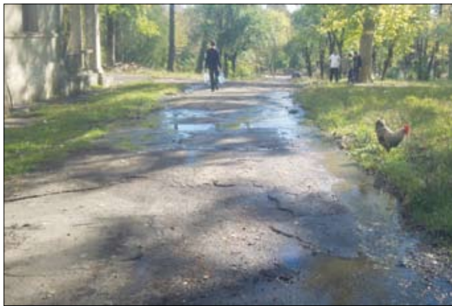
სასმელი წყალი მუშაობაში სანატორიუმიდან