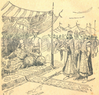
სურ. 2. მეფე დიმიტრი ყაენის წინაშე.