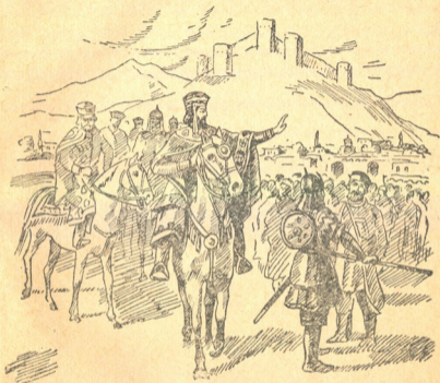
სურ. 1. დიმიტრის წასვლა ურდოში.