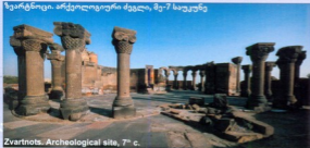
Zvartnots. Archeological site, 7 th c.