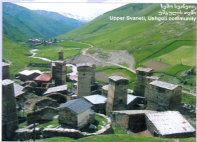
ზემო სვანეთი, უშგულის თემი Upper Svaneti, Ushguli community

The Directorate for Cultural Heritage – Riksantikvaren is responsible for the practical implementation of the Norwegian Cultural Heritage Act and the objectives, laid down, by the Norwegian Parliament (Stortinget). Riksantikvaren comes under the environmental management umbrella, and answers to the Ministry of the Environment. Riksantikvaren collaborates with other directorates in the environmental sector wherever appropriate. International Activities – Working in an international perspective is one of the aims stipulated in the strategy of Riksantikvaren. Through international co-operation Riksantikvaren actively contributes towards safeguarding the cultural heritage of mankind, including cultural rights and cultural diversity.