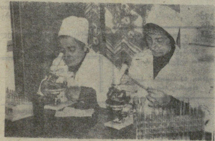
რაისაავადმყოფოს კლინიკურ-დიაგნოსტიკურ ლაბორატორიაში დღემოდამ ხალხმრავლობაა.