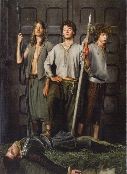
ფოტო: ლეიდენის ენციკლოპედიაში მბრძოლველი კოლხეტი, მარჯვნივ ილარი ლეიდენის ოლფი და გათავისუფლება (1574). მუზეუმ დე ლავენს-დის და ლეიდენის ენციკლოპედიაში კაქცილი.