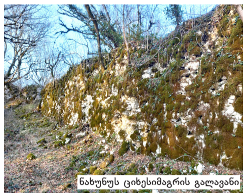
ნახუნუს ციხესიმაგრის გალავანი

სიტყვა „ყალიში“ ფიგურირებს სხვა ტოპონიმებ-