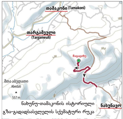
ნახუნუ-თამაკონის ისტორიული გზა-გადასასვლელის სქემატური რუკა

საგულისხმოა ის ფაქტიც, რომ სოფ. ნახუნუში გზათა და საგზაო ნაგებობათა სახელწოდებებზე დაბინძურებულია განაჭკირა „გაჭრალი“ (რესპ.: „გზის გასაყვანად გაჭრილი ბორცვი“), კორიში გიმნაჩამეფიში შარა „კაცის გამყიდველთა გზა“