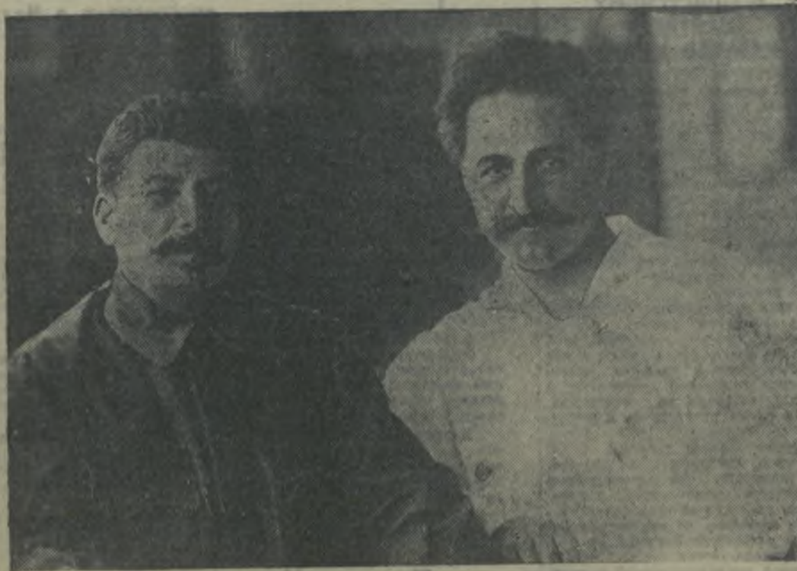
ТОВАРИЩИ И. В. СТАЛИН и С. ОРДЖОНИКИДЗЕ (Тифлиси—1926 г.).

Председатель Совнаркома АЗССР УС. РАХМАНОВ. Секретарь ЦК и БИ АНП(б) БАГИРОВ М. Д.