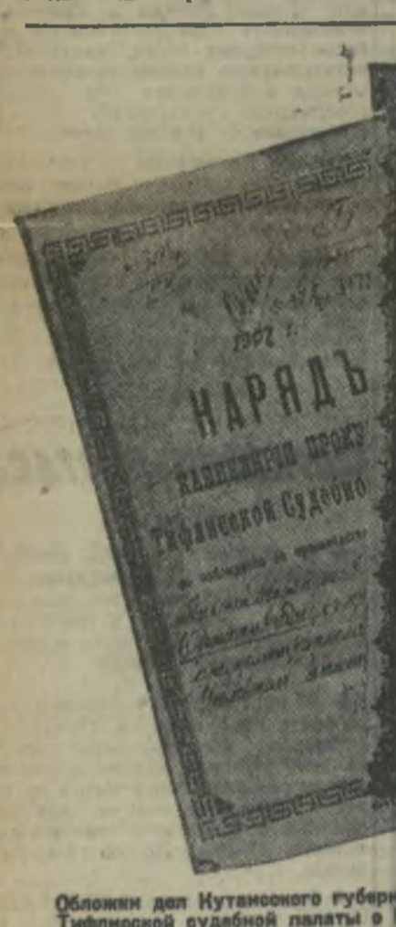
Обложки для Путаевского губернского наместничества и Тифлиской судебной палаты в Г. И. Орджоникидзе (1897—1908 гг.).