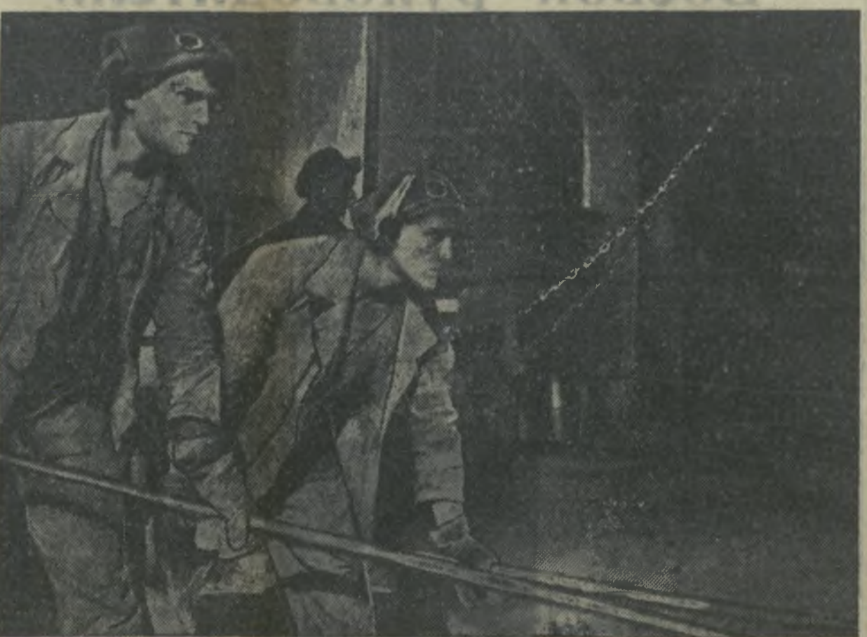
У глиняной печи Дугалынского ферромарганцевого завода.