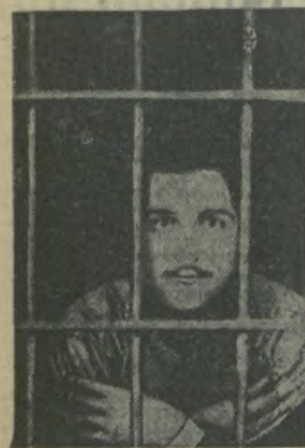
Тов. Г. И. Орджоникидзе в номере суэцкой газеты (1906 год).

С лета 1904 года мне пришлось работать в Харагульском районе. Письма были в руках большевиков и проводили в жизнь указания Имеретинского (большинство) комитета.