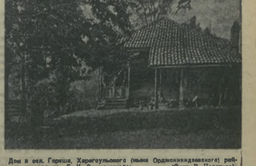
Дом в сел. Гераша, Харагульского (ныне Орджоникидзевского) района, где родился Г. И. Орджоникидзе.

В 1921 году Закавказье было окончательно освобождено от агентов империализма.