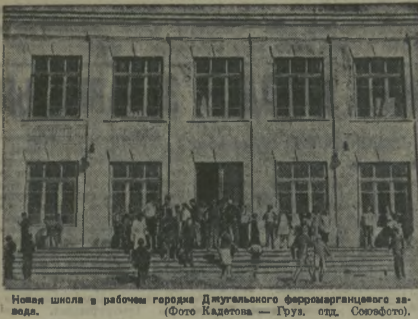
Новая школа в рабочем районе Дугалынского ферромарганцевого завода.

400 патефонов, 800 радиоприемников, 35 фотоаппаратов продал за полтора месяца магазин Союзкульттога в Тбилиси.