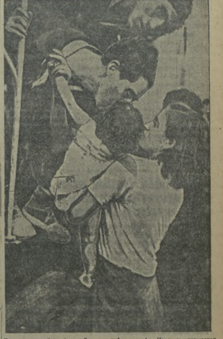
Перед отправкой на фронт. Боец републиканской Испании прощается с семьей.

Мало сказать, что рабочие и рабочий трудящийся шлокопкой фабрике с интересом следят за событиями в Испании. Они переживают эти события, их волнует каждое сообщение о боях героического испанского народа против фашистских палачей. Каждую победу проявляющихся воев Испания на фашистских рабочих шлокопкой принимает, как свою победу, как победу рабочего класса всего мира. О борьбе трудящихся Испании говорит и на митингах, и в беседах, и в пехах, и в зонах. Больше 3 тысяч рублей собрали уже на фабрике в фонд помощи испанскому борцам. А в фабричном клубе рязко галерея партлетов стахановцев, рядом с плакатом об отчетной кампании советов горят на алом подотенные слова: