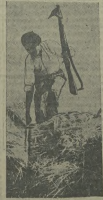
В прифронтовой полосе в Испании вооруженные крестьяне активно помогают республиканским войскам, неся сторожевую службу, охраняя дороги, мосты, проверяя документы проезжающих и т. п.

Сигнахский район выполнил план уборки табака СИГНАХ. (По телеграфу). Сигнахский район выполнил план уборки табака.