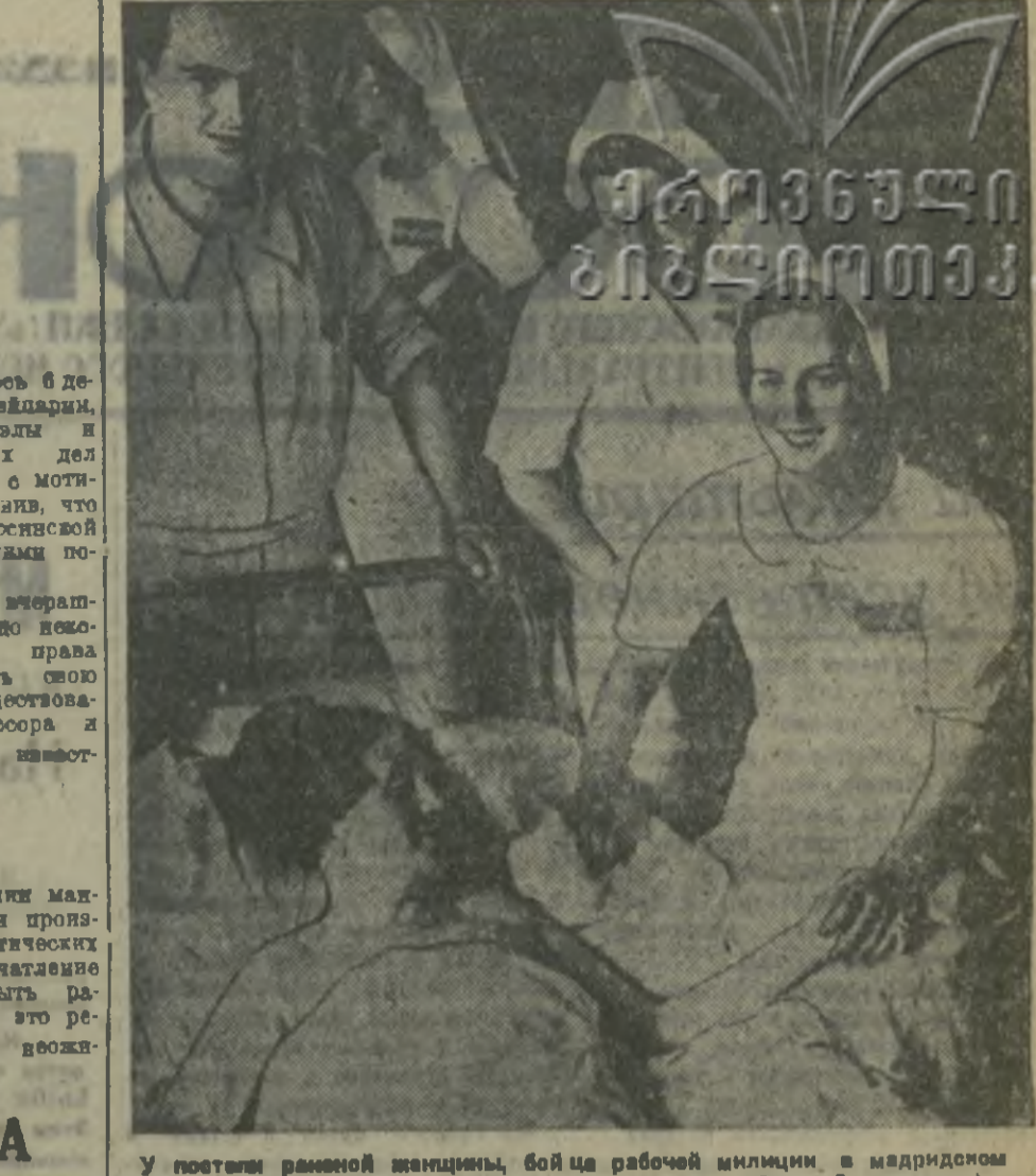
У почты районной женщины, бойца рабочей милиции, в мадрисском госпитале.