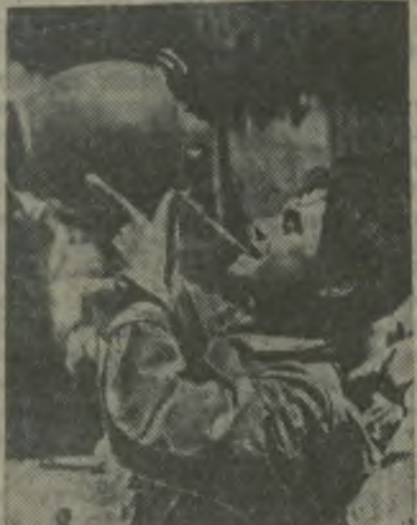
После утомительного похода по пыльным и безводным дорогам Истинный дружинник народной милиции улетит вмаму. (Из авт. журнала «Фронт».)