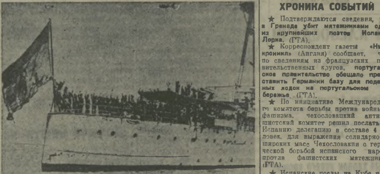
Испанский правительственный истребитель «Мигуа» де Сервантес, принимающий участие в борьбе против мятежников.