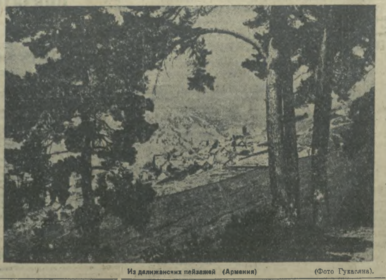
Из далиджанских пейзажей (Армения).