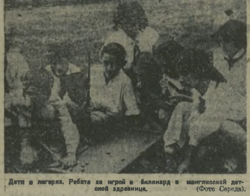
Дети в лагере. Ребята за игрой в бильярд в манглицкой детско-юношеской здравнице.

Тифлисские дети хорошо знают Квишхеты. Сюда, в пионерский лагерь, уже пятый год каждое лето съезжаются на поправку сотни школьников-пионеров.