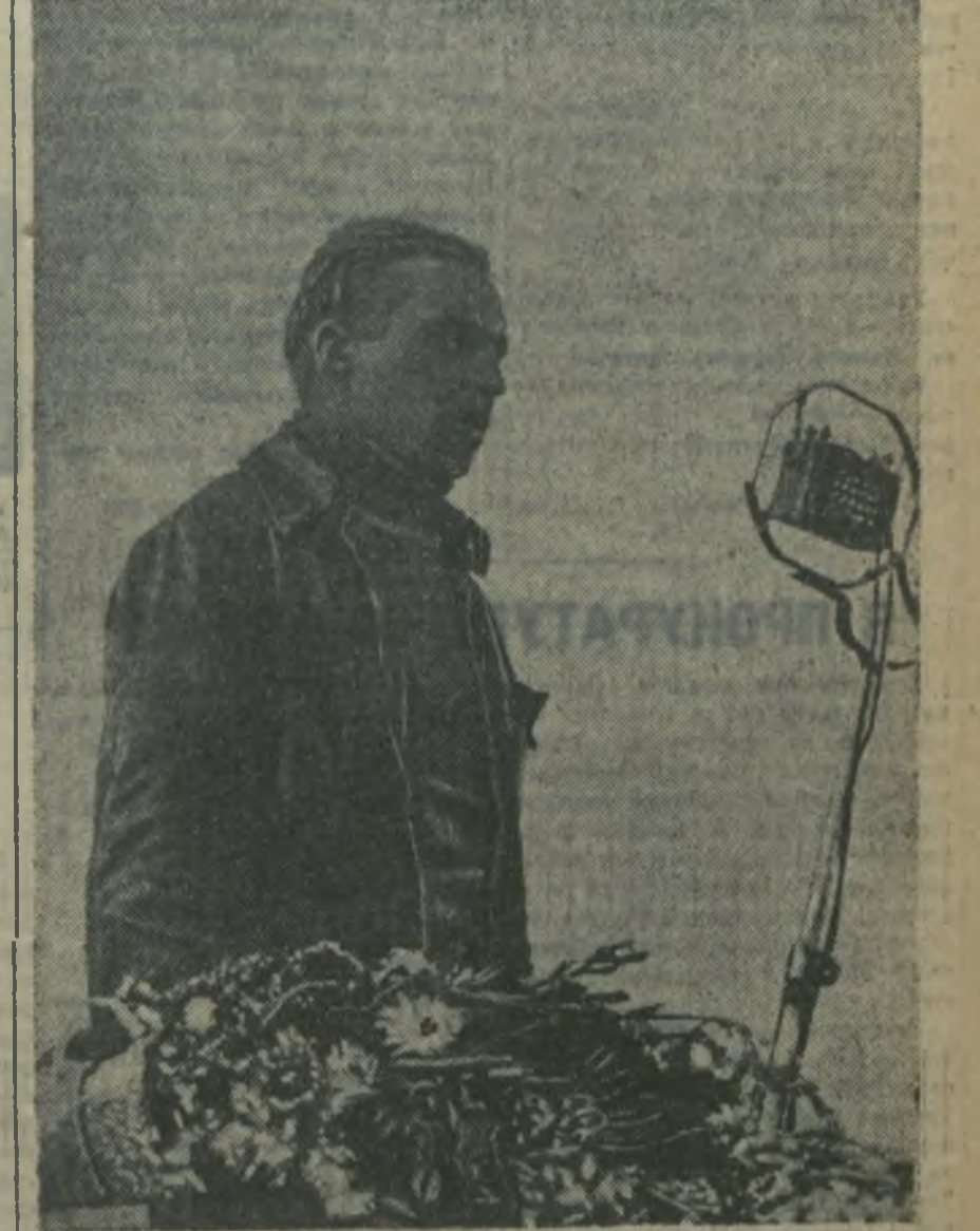
Герой Советского Союза тов. Чкалов выступает на митинге на Щелковском аэродроме в день прилета «АНТ-25» в Москву.