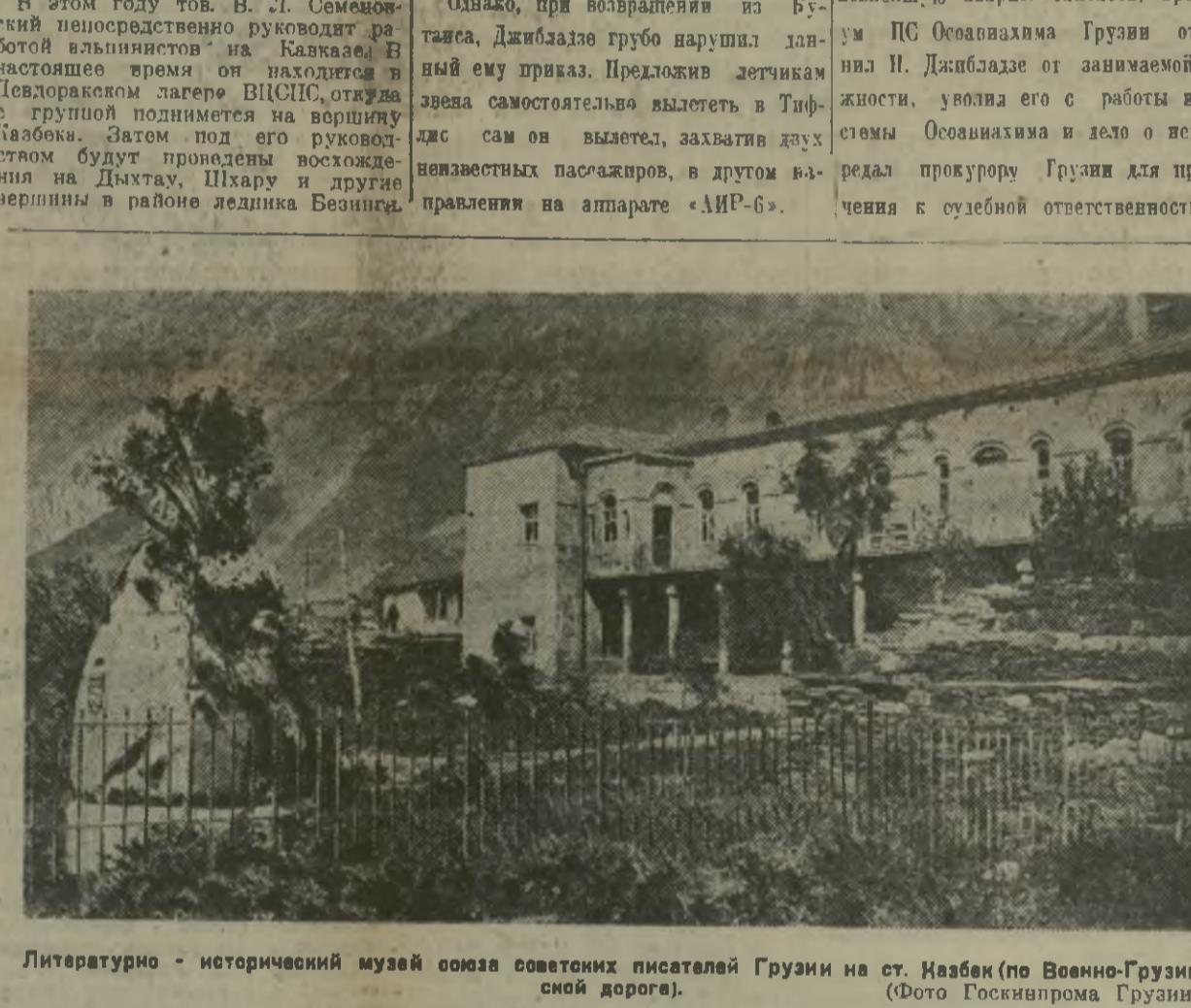
Литературно-исторический музей союза советских писателей Грузии на ст. Казбек (по Военно-Грузинской дороге).