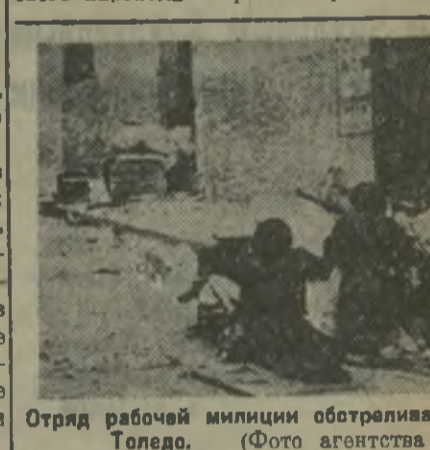
Страд рабочей милиции обстреливает мятежников, на одной из улиц Толедо.

Париж, 11. (ЭТА). «Юманите», сообщает, что сегодня, утром, в Гавр прибыл бразильский пароход «Бател», являющийся на Рио-де-Жанейро.