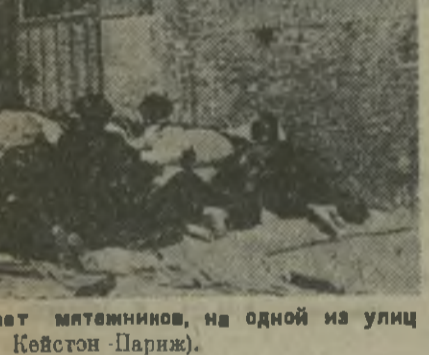
Страд рабочей милиции обстреливает мятежников, на одной из улиц Толедо.

ВВЛАХ. (По телефону). В течение 30 рабочих дней совхоз им. Орджоникидзе закончил уборку колхозных полей в 14.000 га.