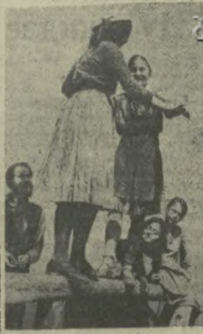
В парке культуры и отдыха пионеров и школьников в Тифлисе. Дети развлекаются спортивной игрой «Кто-кого?».