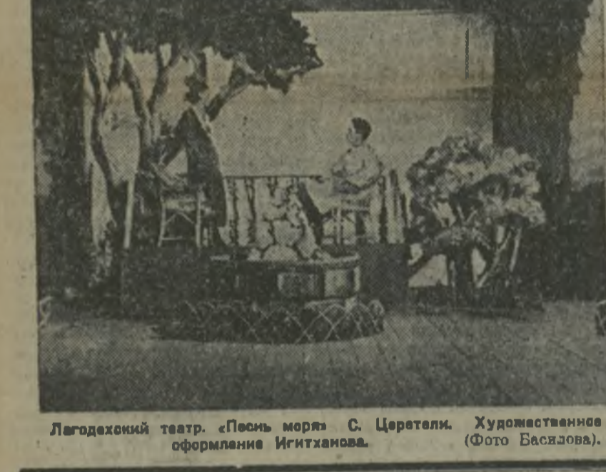
Лагодехский театр. «Песнь моря» С. Церетели. Художественное оформление Игитшанова.

ЛАГОДЕХИ. (Наш спец. корр.) Драго не ладится работа Лагодехского драматического театра.