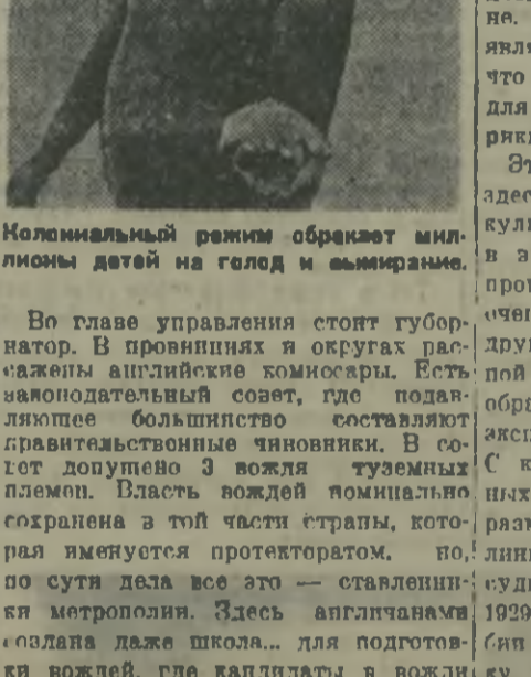
Колониальный режим обременяет миллионы датей на голод и вымирание.

Внутренний район страны прославился, хотя формально она была открыта в 1874 г. На всей территории применяется принудительный труд. Сьерра-Леоне — колония (прибрежный район) и протекторат (в глубь страны). Площадь — 80 тысяч кв. км. Туземное население — 1.542.000 человек, европейцев — 1.200. Главный город — Фритаун. История завоевания прибрежных районов Сьерра-Леоне не совсем обычна. В XVII—XVIII вв. эта территория представляла собой пустынную местность, населенную племенами белых охотников за рабами, что совершенно обесценило это поприще англичан... Система управления Гамбией подобна установленной в Сьерра-Леоне. Основным объектом эксплоатации является мелкое туземное хозяйство, что типично, как уже указывалось, для всей Британской Западной Африки.