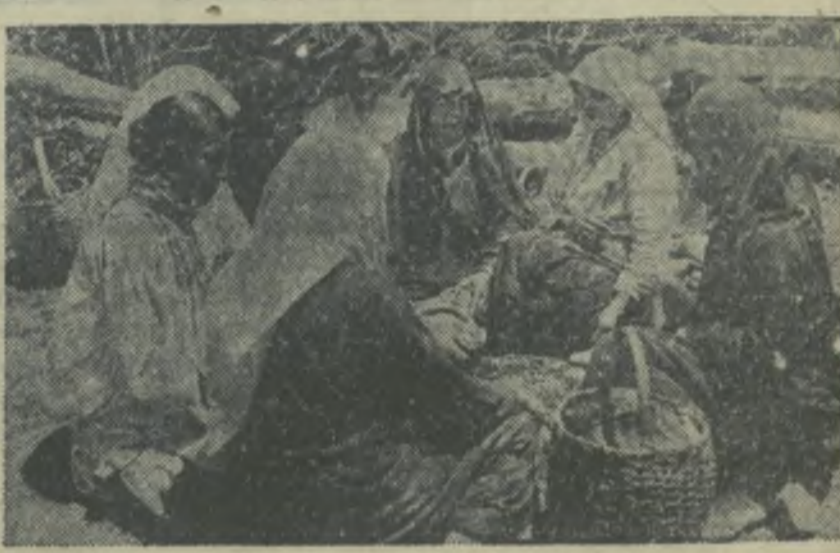
Колхозница Ленинского района (Юго-Осетия) обсуждает проект Конституции Союза ССР.

Женщины в СССР предоставляют равные права с мужчинами во всех областях хозяйственной, государственной, культурной и общественно-политической жизни.