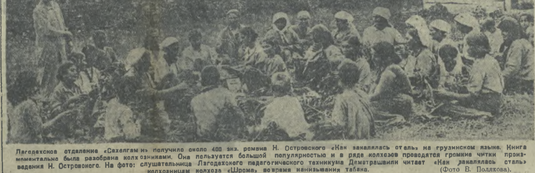
Лагодехское отделение «Сахалгам» получило около 400 экз. романа Н. Островского «На закате отлея» на грузинском языке.