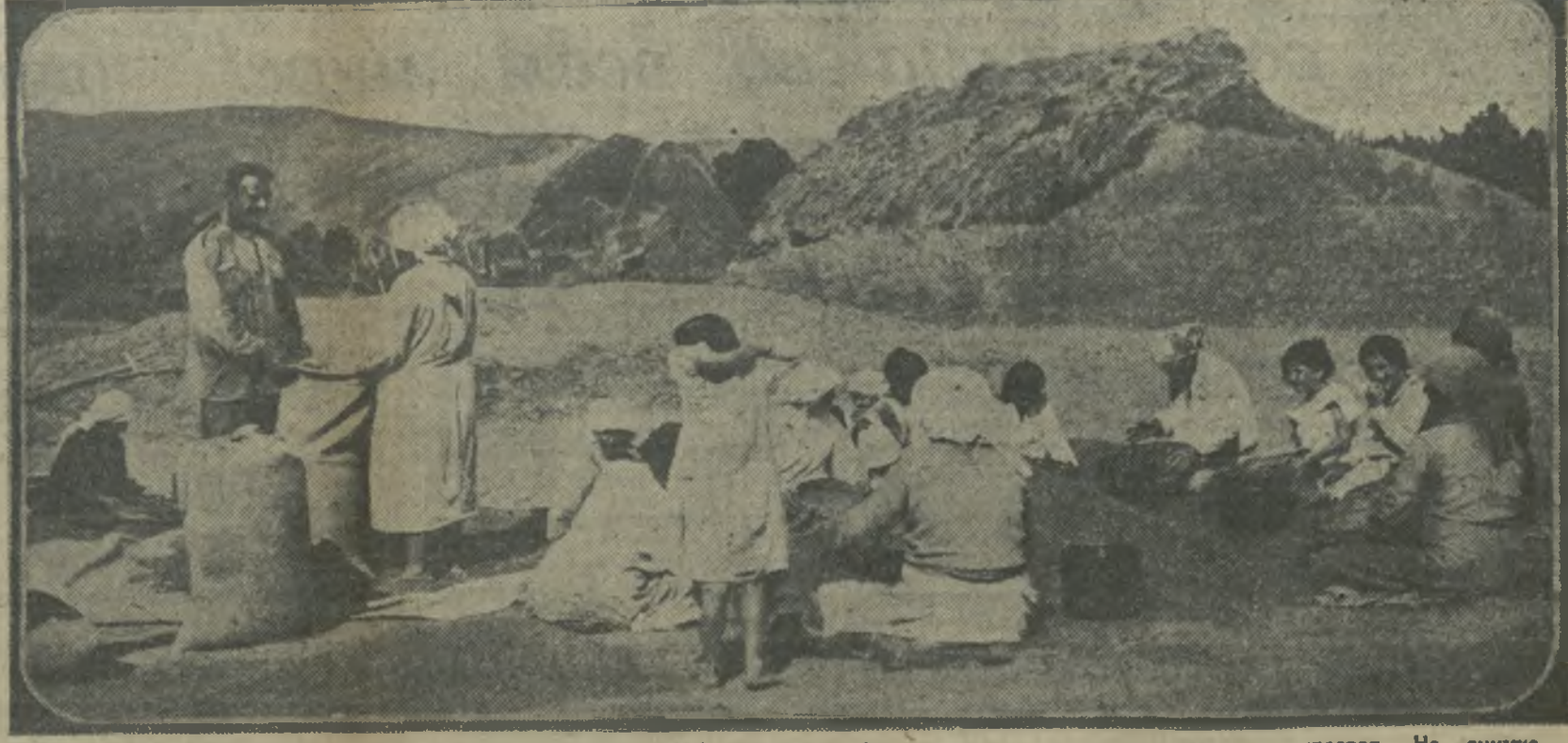
В колхозе сел. Ахалцива Каспского района идет молотба. Сразу после обмола та зерно просеивается и просушивается. На снимке — просушка зерна.