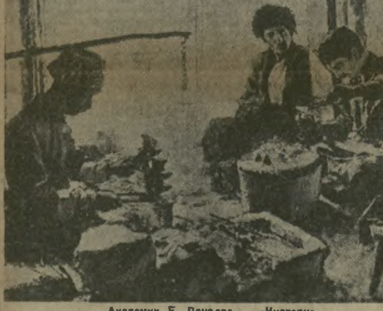
Академик Е. Лансере — «Нустари».