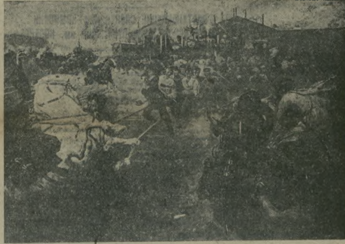
«Разгон бастующих рабочих ж.-д. мастерских в Тифлисе» — картина худ. И. Вепхвадзе.

Выставка служит еще одним ярким подтверждением того, что только партия большевиков, борющаяся и побеждающая под руководством великого Сталина, способна обеспечить и обеспечивает наилучшие условия для пышного расцвета культуры и искусства.