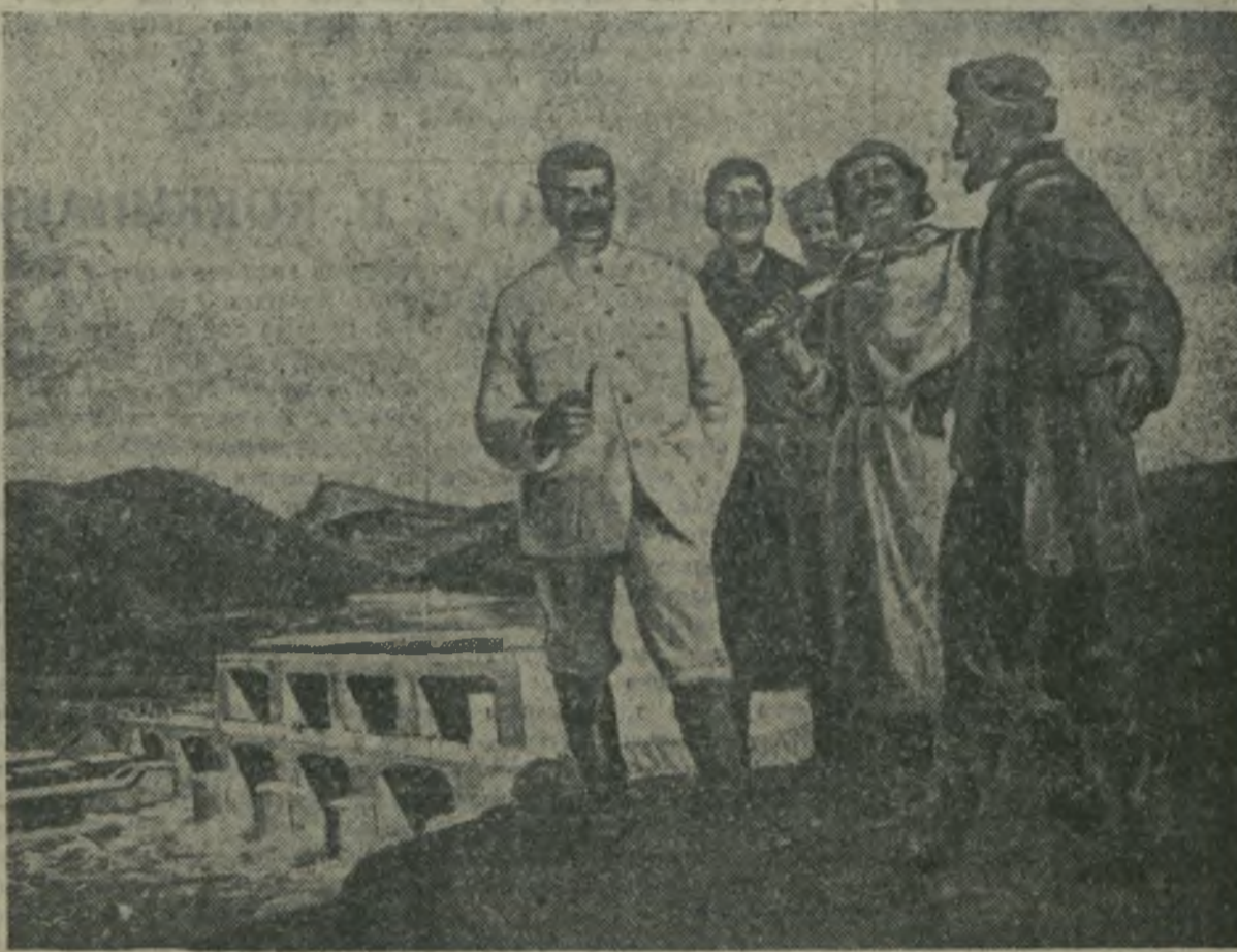
«Товарищ Сталин на Рионгесе» — картина худ. И. Тондзе.

(Л. БЕРИЯ — К вопросу об истории большевистских организаций в Закавказье)