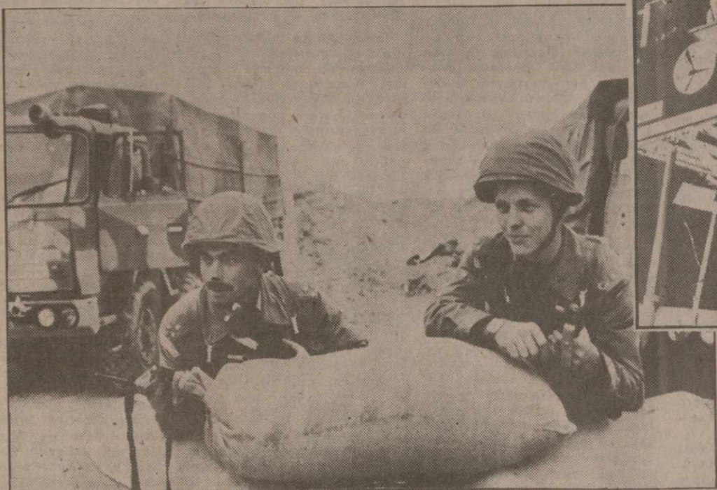
В отличие от Советского Союза новые Чехо-Словакия и Польша активно поддерживают усилия многонациональных сил в Персидском заливе. Чехо-Словакия направила сюда специальное подразделение противотанковой защиты. На снимке: военнослужащие