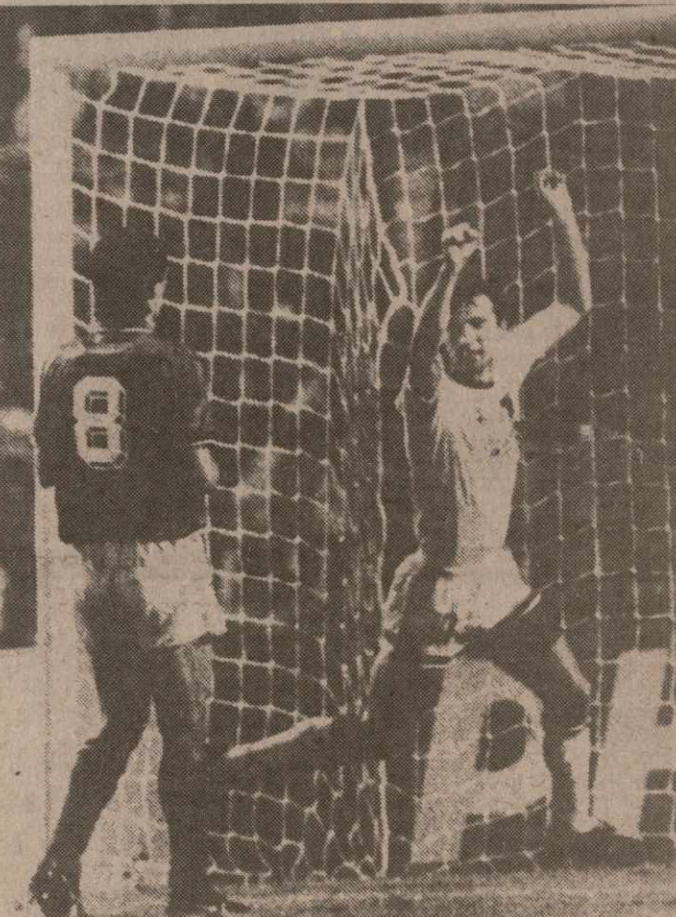
Футбол — прекрасная игра.

Здесь же, пользуясь случаем, хочу напомнить всем, кто желает поспособствовать НОКу республике, наш расчетный счет 00070608 Тбилиского управления Промстройбанка Грузии. Код: 521921.