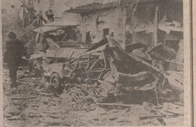
На снимке: на месте ракетного обстрела в Тель-Авиве.