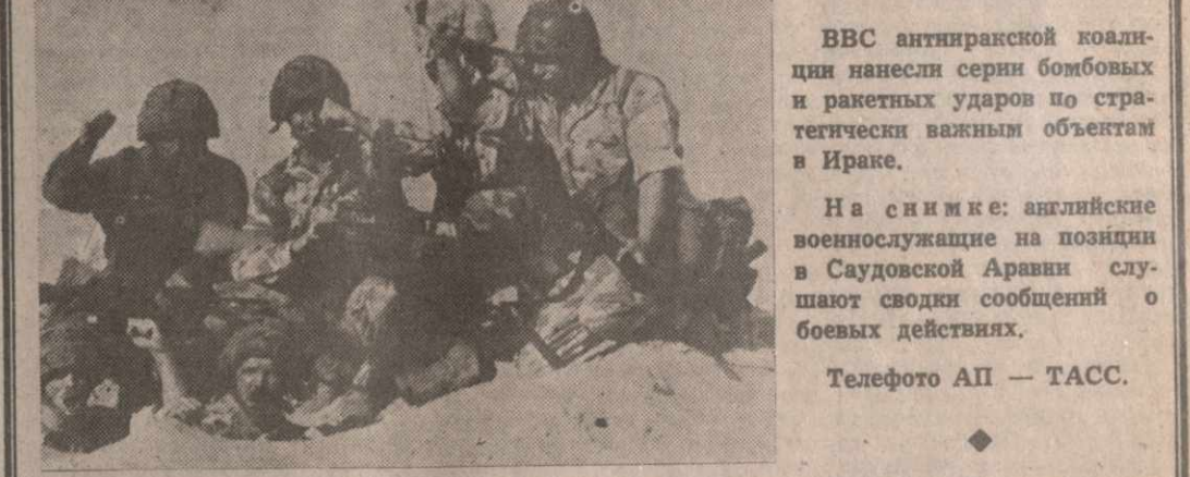
ВВС антииракской коалиции нанесли серию бомбовых и ракетных ударов по стратегически важным объектам в Ираке.