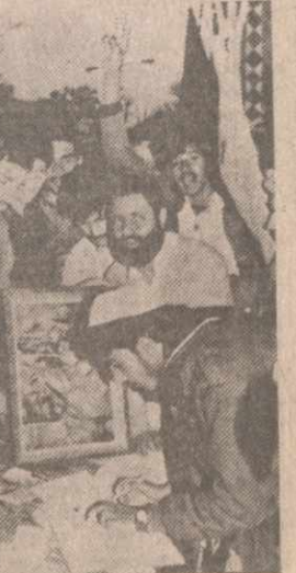
Значительная часть мусульманского мира готова откликнуться на призывы Саддама Хусейна в священной войне против США и их союзников.

эксперимент, целью которого является исследование процессов производства и невосстановления монокристаллов кремния методом бестепловой зонной плавки. В программу для экипажа также включены такие эксперименты по определению спектральных характеристик космического излучения и оценке состояния образцов конструктивных материалов, установленных на внешней поверхности комплекса. Работа в космической лаборатории продолжается.