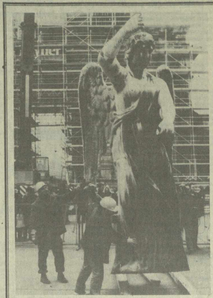
● БЕРЛИН. 6 августа 1990 года будет торжественно отмечаться 200-летие Бранденбургских ворот. К этому времени свое законное место займет их главная достопримечательность — квадрига победы, которая снята недавно для реставрации. Памятник работы известного немецкого скульптора Иоганна Готфрида Шадова реставрируют самые квалифицированные специалисты из ГДР и ФРГ в западноберлинском музее техники и транспорта. На снимке: богине Нике пришлось пока спуститься на землю...

«Зеленый свет» этим событиям бесспорно дала советская перестройка. Но зрели оно давно. В большинстве этих стран были попытки собственной перестройки. Но их подавили. В Польше даже дважды — в 1956-м и 1980-м. В Чехословакии — в 1968-м, в Венгрии — в 1956-м. Силы внутри коммунистических партий, выступавшие за реформы и способные завоевать доверие, были убиты. И неудивительно, что сегодня наступила расплата за «грехи» тоталитаризма. В ряде стран Восточной Европы в процессе происходящих там перемен под ударом оказались многие тысячи честных, искренне преданных идеям прогресса людей. И изменения, которые буквально в одночасье лишили Восточную Европу привычного облика, воспринимаются многими неоднозначно. Но исторические грозы очищают атмосферу... Удается ли государствам Восточной Европы утвердить свою роль на континенте? Как сложатся отношения между ними и нами? Каким образом преодолеть все нарастающие проблемы в развитии сотрудничества и взаимопонимания? Ответы на эти и многие другие вопросы даст время. Но факт — динамика и характер событий дают уникальные шансы для таких решений, которые могут сделать начало 90-х годов исторической вехой в мировом и особенно европейском развитии.