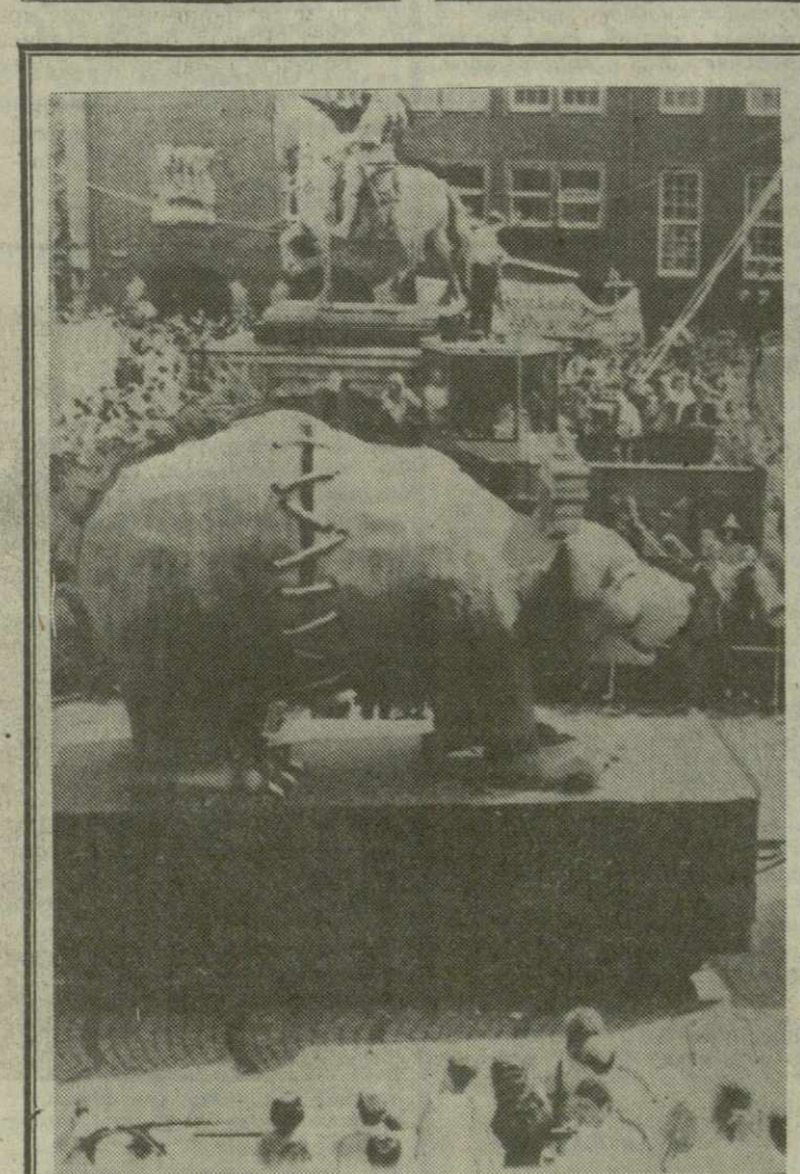
● Символом процесса объединения Германии стали соединенные половинки традиционного берлинского медведа во время праздничного карнавала в западногерманском городе Дюссельдорфе.

Радикалы в рядах Болгарской социалистической партии требуют провести съезд партии не позднее 15 сентября, причем первый съезд, а не 39-й, как намечается, отдавая дань истории болгарской социал-демократии. Студенческие студенческие комитеты провели в Велико-Тырново общенациональный слет и заявили о создании новой политической организации студенчества. Тодор Живков переведен под домашний арест. Тело Георгия Димитрова будет похоронено на центральном софийском кладбище рядом с могилой его матери. Такое решение приняла общественная комиссия, созданная из авторитетных государственных, политических и общественных деятелей, видных представителей науки и культуры. Как сообщил, выступая по телевидению, председатель Совета Министров НРБ А. Луканов, столичному народному совету поручено рассмотреть вопрос о том, как лучше использовать в дальнейшем здание нынешнего Мавзолея Г. Димитрова. Глава правительства подчеркнул, что вопрос, связанный с именем и делом одной из наиболее ярких фигур в современной истории страны, следует решать, учитывая авторитет болгарского государства и чувства болгарского народа.