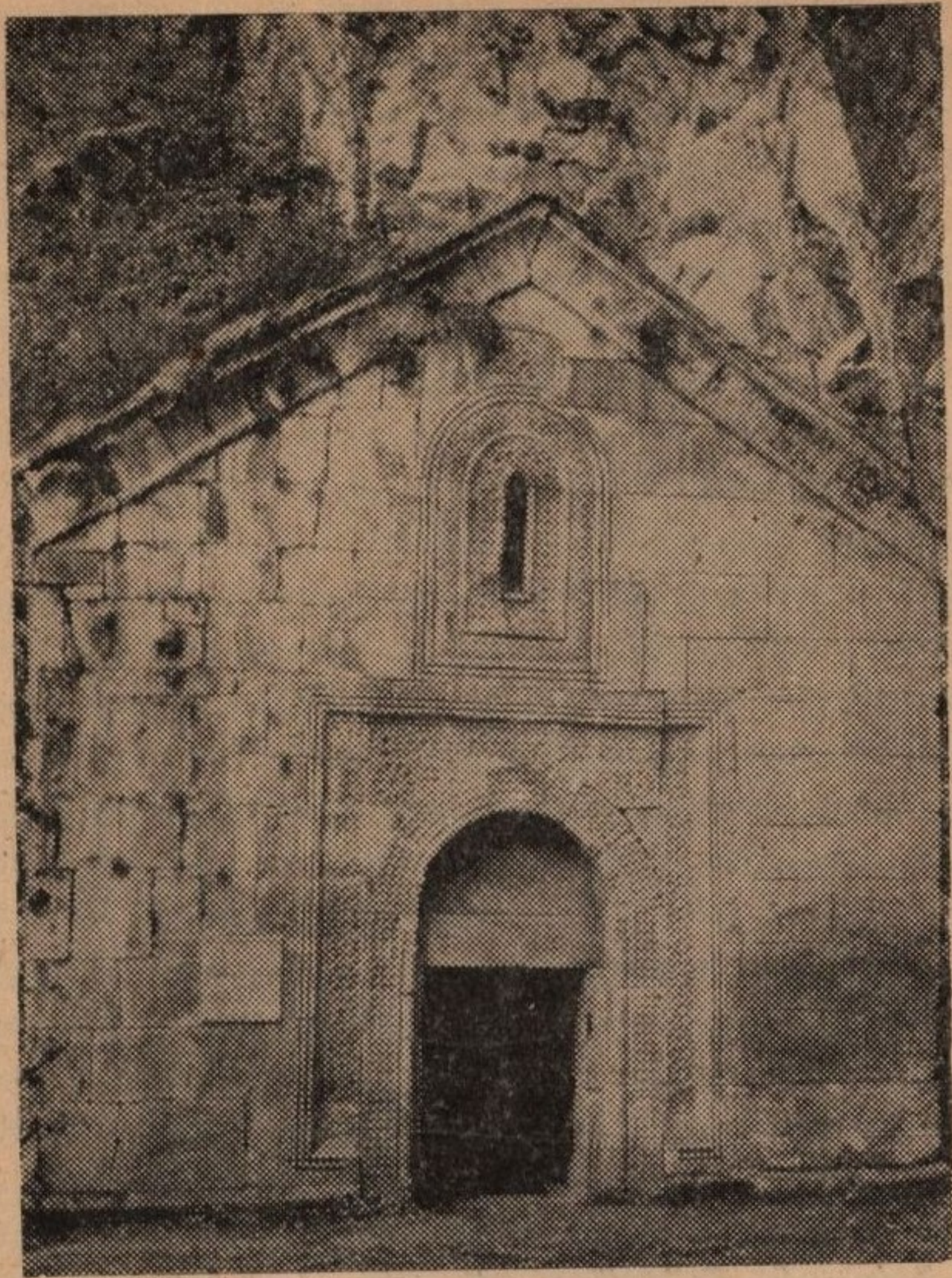
სოფ. ღაბის ეკლესია

დაშლის მოკავშირედ გამოდიოდა. მიუხედავად იმისა, რომ XIII—XIV—XV საუკუნეებში სამცხე ხშირად დამოუკიდებელ სამთავროს წარმოადგენდა, მას საქართველოსთან პოლიტიკური კავშირი ამ პერიოდშიც არ გაუწყვეტია. ამ დებულების დამადასტურებლად ბექა I-ისა და ალბულა I-ის მანდატურთუხუცესობა და ამირსპასალარობა შეიძლება დავასახელოთ. ამ საკითხზე სწორი აზრი გა-