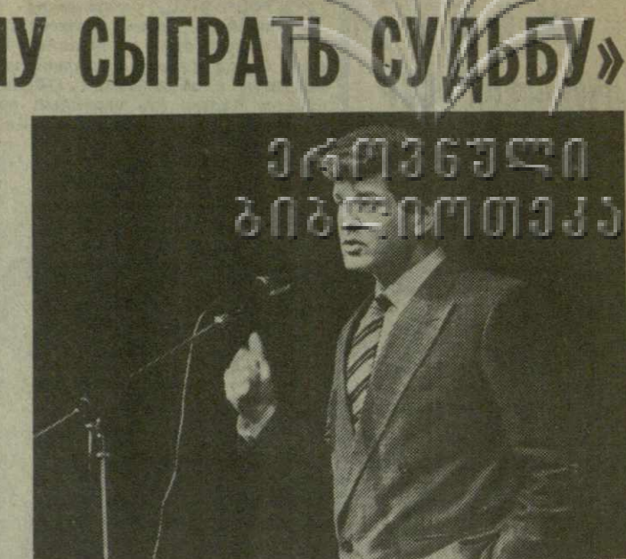
искусстве на фоне социальной перестройки общества.

— Сегодня вам был задан вопрос о том, какие изменения происходят в