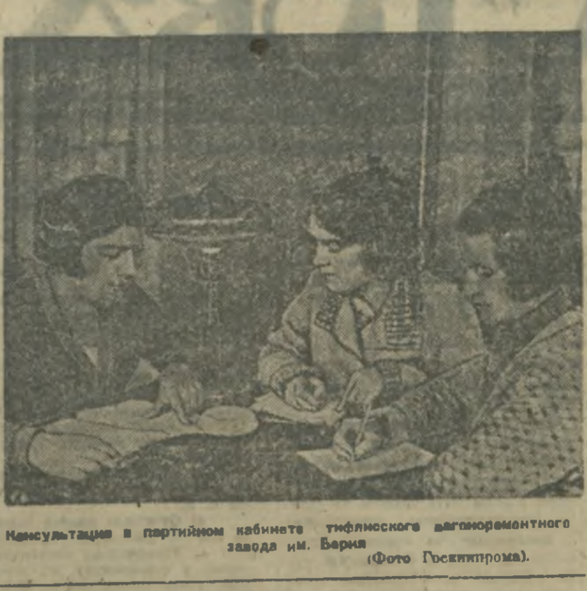
Консультация в партийном кабинете тифлисского вагоностроительного завода им. Бария.