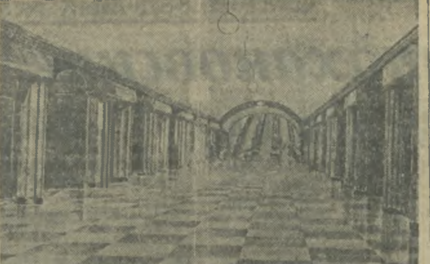
Станция Московского метро «Площадь Свердлова»...