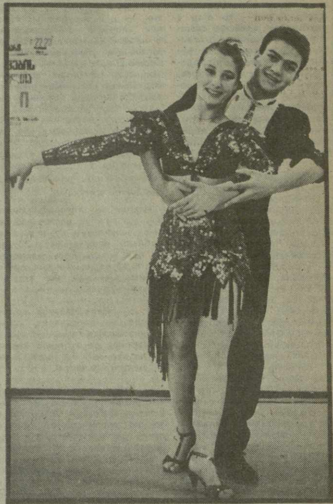
Эффективная пара, не правда ли? Добавим: и очень талантливая...