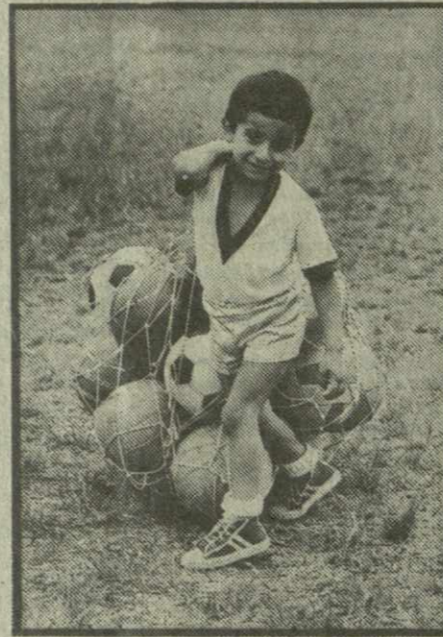
Мячи для чемпионата