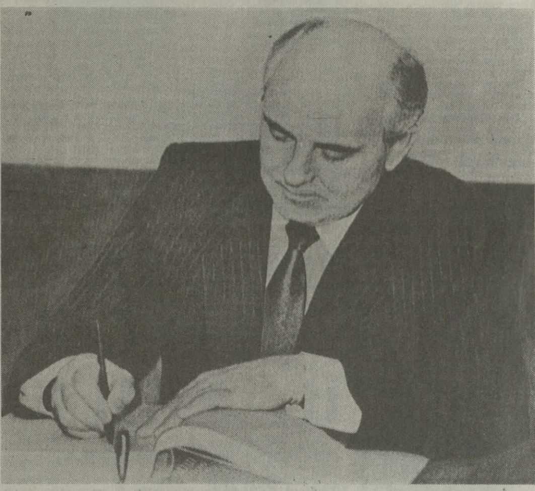
На снимке: М. С. Горбачев расписывается в Книге почетных гостей.

Тем же в этот же день глава Советского государства посетил парламент Финляндии. Составилась беседа с председателем парламента Калевой Сорсой, рассказавшим об основных направлениях деятельности высшего законодательного органа страны, его комитетах и комиссиях. М. С. Горбачев и Р. М. Горбачева расписались в Книге почетных гостей.